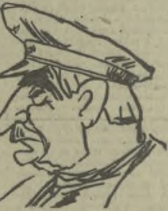
Народный артист СССР, лауреат Ленинской премии С. Закарнадзе в роли Давида из пьесы Р. Эбралидзе и С. Даядзе «Мы, его величество...». Дружеский париж румынского художника Сильвана.

Ф. ДЖИНДЖИХАШВИЛИ, старший преподаватель института иностранных языков, член правления Грузинского отделения Общества советско-румынской дружбы.