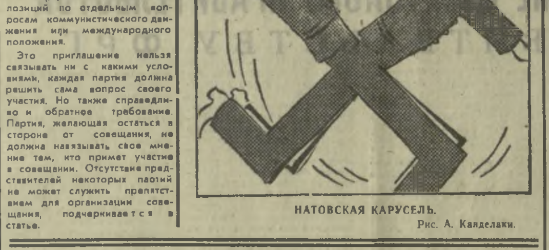
НАТОВСКАЯ КАРУСЕЛЬ. Рис. А. Кавдалаки.