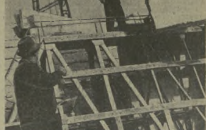
Тбилисский завод железобетонных конструкций № 1 — один из крупных предприятий строительной индустрии республики. Коллектив завода снабжает своей продукцией многие новостройки.

На снимке: один из участков завода.