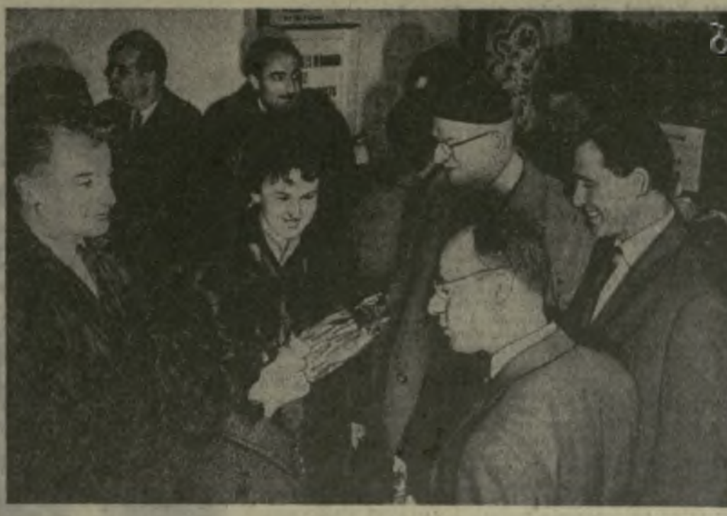
Приезд друзей — всегда радость. Но особенно приятно, когда друзья знакомят тебя с духовным богатством своего народа. Вот почему так радостно встречали делегацию искусства Румынии своих соотечественников — артистов театра имени Шота Руставели. Грузинское театральное искусство пользуется заслуженной славой у нас в стране. А сейчас с ним познакомилась и за рубежом. Хочется пожелать, чтобы большой успех коллектива в Румынии стал залогом новых творческих побед.

Но значение гастролей не ограничивается сказанным. Гастроли руставелевцев — это первый выход грузинского драматического театра за пределы Советского Союза. Известно, что за последние годы интерес к грузинскому искусству за рубежом заметно растет: успехом пользуется грузинская народная песня, хорошо знают во мно-