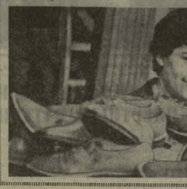
Коллектив тбилисской обувной фабрики «Исани» достоинно несет трудовую вахту в честь 50-летия Великой Октябрь. Реализуя принятые на себя социалистические обязательства, обувщики досрочно, 24 июня завершили полугодовую программу юбилейного года и дополнительно к заданию выпустили десятки тысяч пар различной обуви. В авангарде предоктябрьского социалистического соревнования идет коллектив коммунистического предприятия по производству обуви.

50-ЛЕТИЮ ОКТЯБРЯ — ДОСТОЙНУЮ ВСТРЕЧУ. ОБЩЕСТВЕННЫЕ КОРРЕСПОНДЕНТЫ «ЗАРИ ВОСТОКА» СООБЩАЮТ: Ткибульские земледельцы и животноводы успешно несут вахту в честь 50-летия Великой Октябрь. Труженики фермы давно уже приступили к заготовке продукции животноводства в счет второго полугодия. Хорошо трудятся и вездные чаеводы. Они собрали уже 2,500 тонн сортового листа, значительно перевыполнив майско-июньское плановое задание. Г. ГЕЦАДЗЕ.