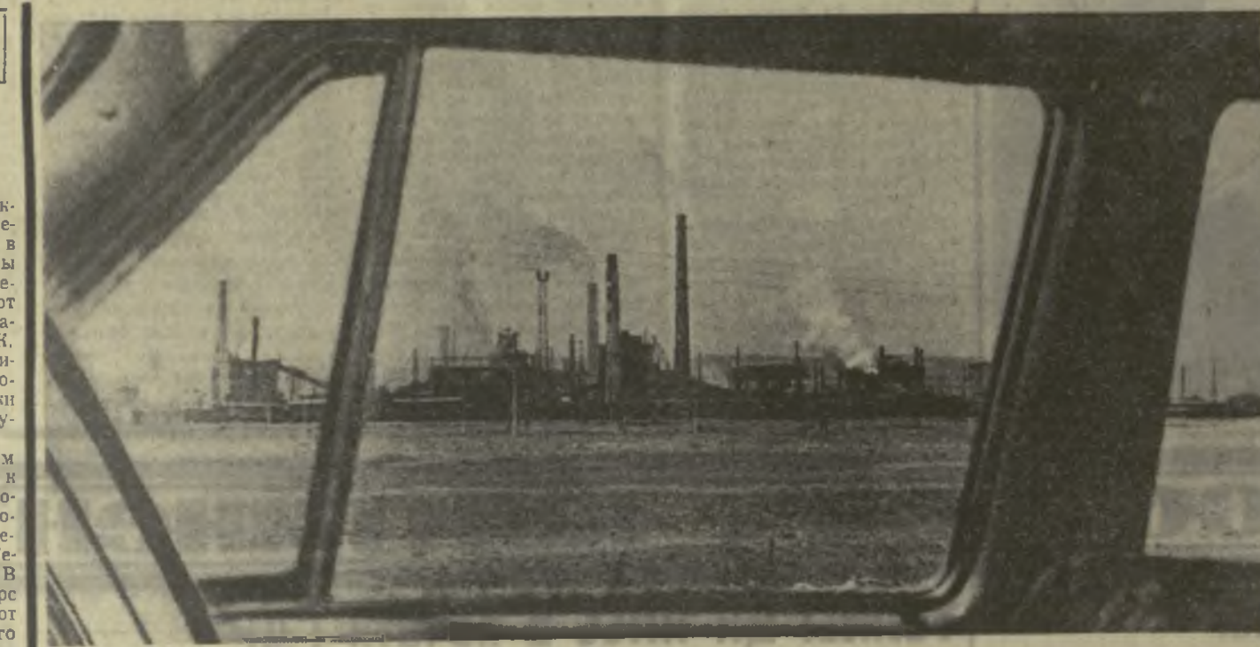
Рустави. Индустриальный пейзаж.