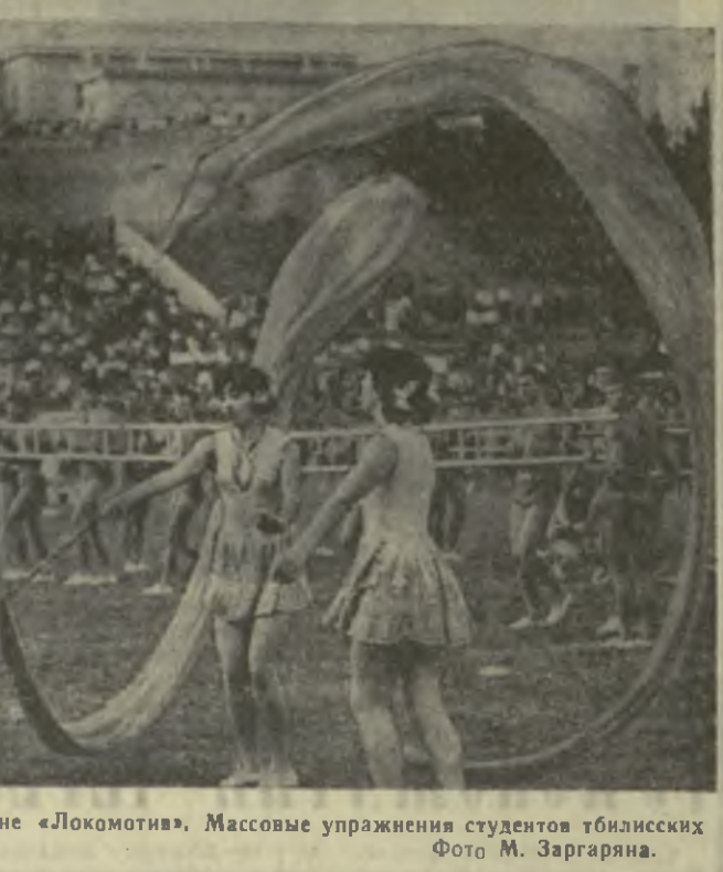
Массовые упражнения студентов тбилисских вузов.