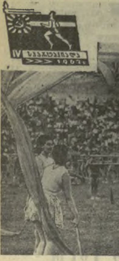
Спортивный праздник на стадионе «Локомотив». Массовые упражнения студентов тбилисских вузов.