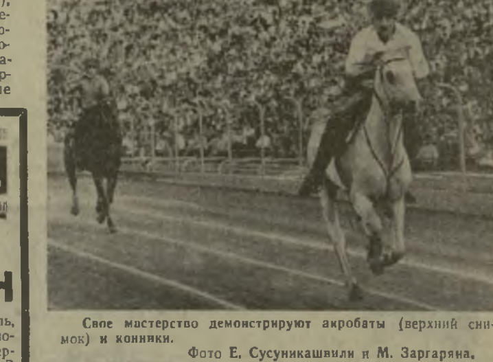
Свое мастерство демонстрируют акробаты (верхний снимок) и конники.