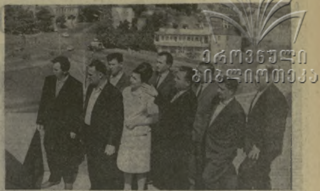
Посланцы Выселковского района Краснодарского края в представителях Цителцаройского района осматривают достопримечательности города Тбилиси.

...Наше путешествие по шахте продолжается. Главное, что обращает на себя внимание, — это современность новостройки. Отлично потрудился здесь коллектив строительного управления «Ткварчельшахтострой». Просторные подземные коммуникации, высокий уровень технической оснащения, отличная организация работы транспорта — словом, здесь предусмотрено все для разумной, экономичной и в то же время удобной эксплуатации угольных месторождений. Лавы, забой пронизали густой Ходжала во многих направлениях. Вместе с добытчиками — вернее, впереди них — идут, как всегда, проходчики. Это они прокладывают путь в подземном кладовом. Подземными скоростями проследы здесь Ардашев Гиндия, Павел Кап-