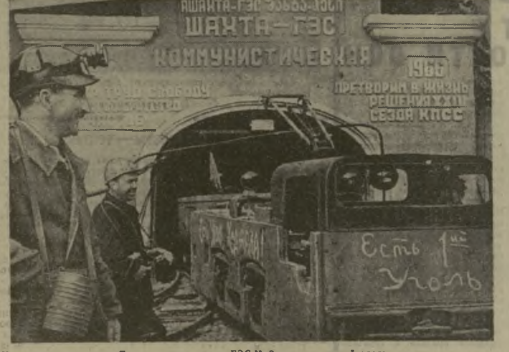
На снимке: новая Ткварчельская шахта-ГЭС № 8 выдала первый уголь.