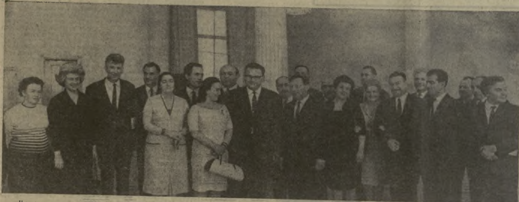
На снимке: участники Дней Грузии в Москве среди московских друзей.