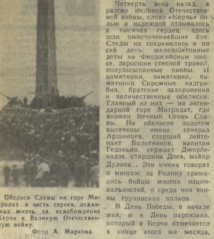
Обелиск Службы на горе Митридат в честь героев, отдавших жизнь за освобождение Керчи в Великую Отечественную войну.