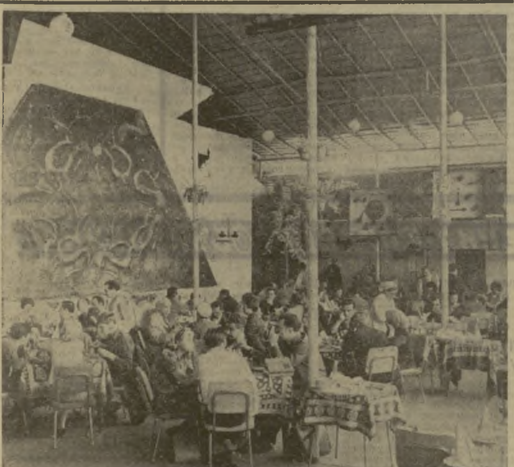
В эти дни посетители ВДНХ знакомятся с искусством грузинской кухни. На снимке: зал ресторана «Сакартвело». Фото Г. Вахтангадзе. (Спец. корр. «Зари Востока».)

На снимках: вверху — солисты Грузинской государственной филармонии, заслуженные артистки Грузинской ССР Ц. Цицишвили и Н. Кервалидзе в сопровождении Большого хора Всесоюзного радио и телевидения под руководством народного артиста СССР К. Птицы исполняют песню С. Туликова «Москва — Тбилиси». Внизу — артисты балета Тбилисского государственного академического театра оперы и балета им. З. Палиашвили Натела Аробелидзе и заслуженный артист Грузинской ССР Бекар Монавардидзашвили на сцене Кремлевского театра исполняют адажио из балета Чайковского «Спящая красавица».