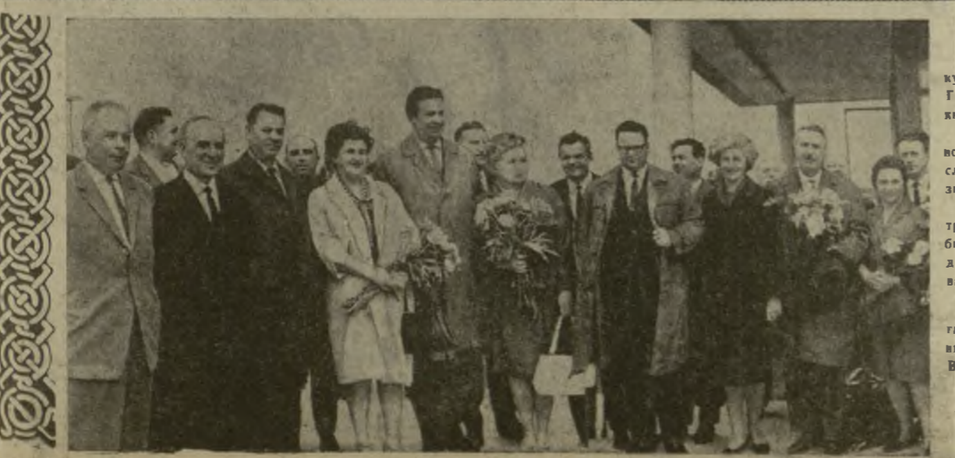
На снимке: делегация Грузии с представителями Москвы во Внуковском аэропорту. Фото Г. Кивкадзе. (Связок принят по фототелеграфу ГрузТАГа).

Дружба наша бессмертна. За ней века общей борьбы, общих достижений. За ней пятьдесят лет, пройденных рука об руку по ленинскому пути под руководством Коммунистической партии.