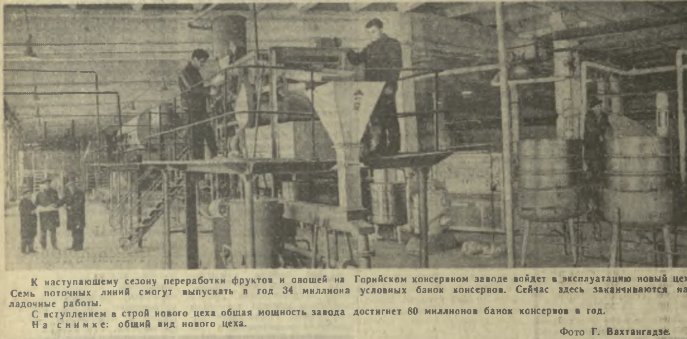
К наступающему сезону переработки фруктов и овощей на Горьком консервном заводе войдет в эксплуатацию новый цех. Семь поточных линий смогут выпускать в год 34 миллиона условных банок консервов. Сейчас здесь заканчиваются наладочные работы.