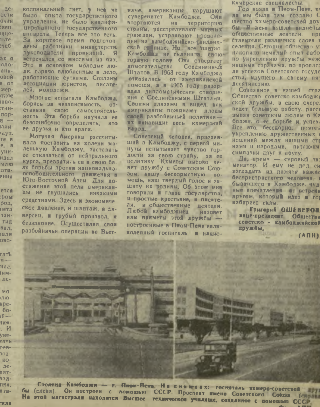
Стоянка Камбоджи — г. Пном-Пень. На слайдах: госпиталь кхмеро-советской дружбы (слева). Он построен с помощью СССР. Проспект имени Советского Союза (справа). На этой магистралье находится Высшее техническое училище, созданное с помощью СССР.