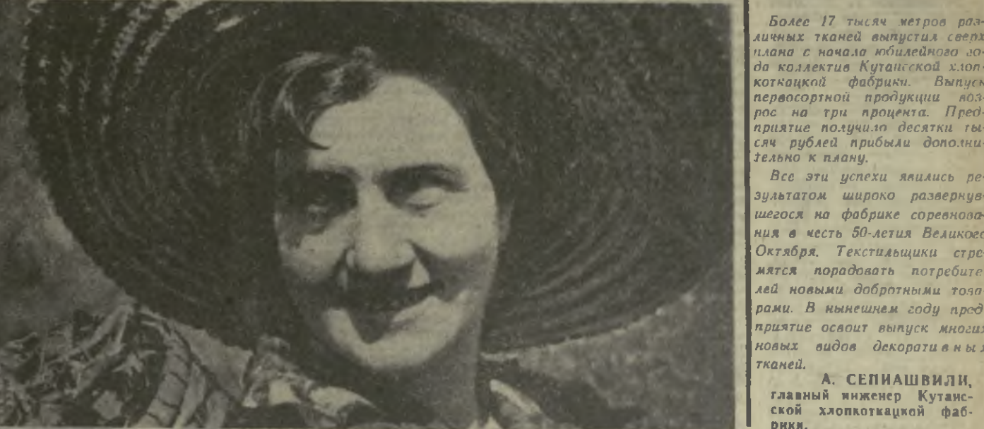
Одними из первых в республике начали сбор чая часоводы колхоза имени Жданова села Дабзу Махарадзевского района.

Продукция Тбилисского машиностроительного завода имени 28 комиссаров широко применяется на винодельческих предприятиях как ишей республики, так и других республик страны. Реализуя обязательства, принятые в честь 50-летия Великого Октября, машиностроители в нынешнем году освоили серийный выпуск новых виноградных прессов непрерывного действия «ВМД-5». Каждая из этих машин может переработать в час пять тонн винограда. А в экспериментальном цехе ведутся работы по освоению новых видов продукции — виноградных дробилок «ВДГ-10» и «ВДГ-20».