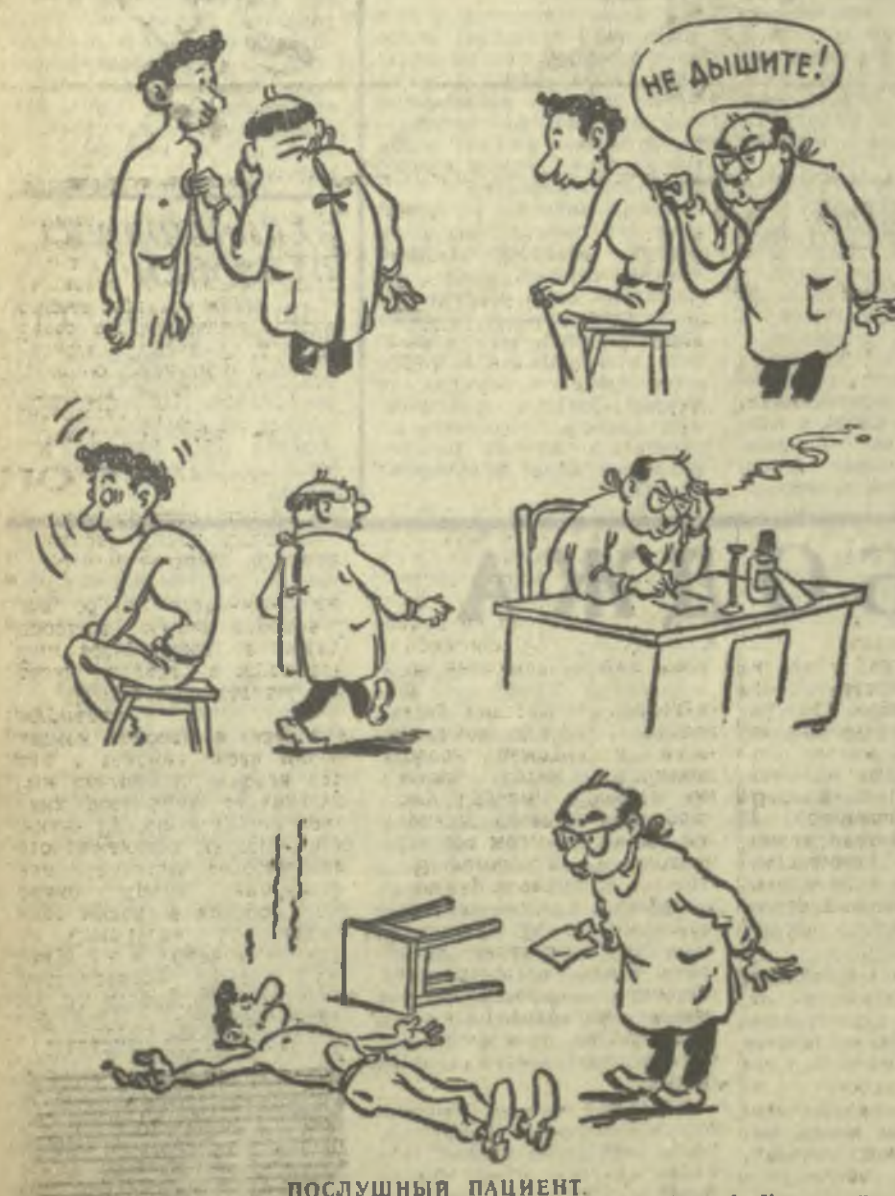
ПОСЛУШНЫЙ ПАЦИЕНТ. Рис. А. Канделаки.