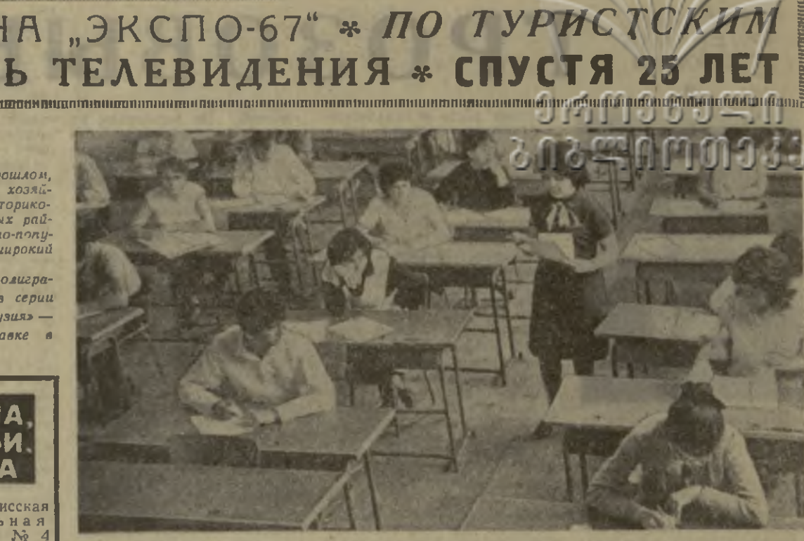
Вчера в школах республики начались ответственный период: выпускники школ сдавали первый экзамен.

В Хашури идет строительство галантерейной фабрики. Новое предприятие будет оснащено современным отечественным оборудованием.