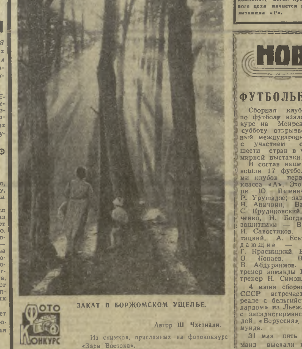
Из снимков, присланных на фотоконкурс «Зари Востока».