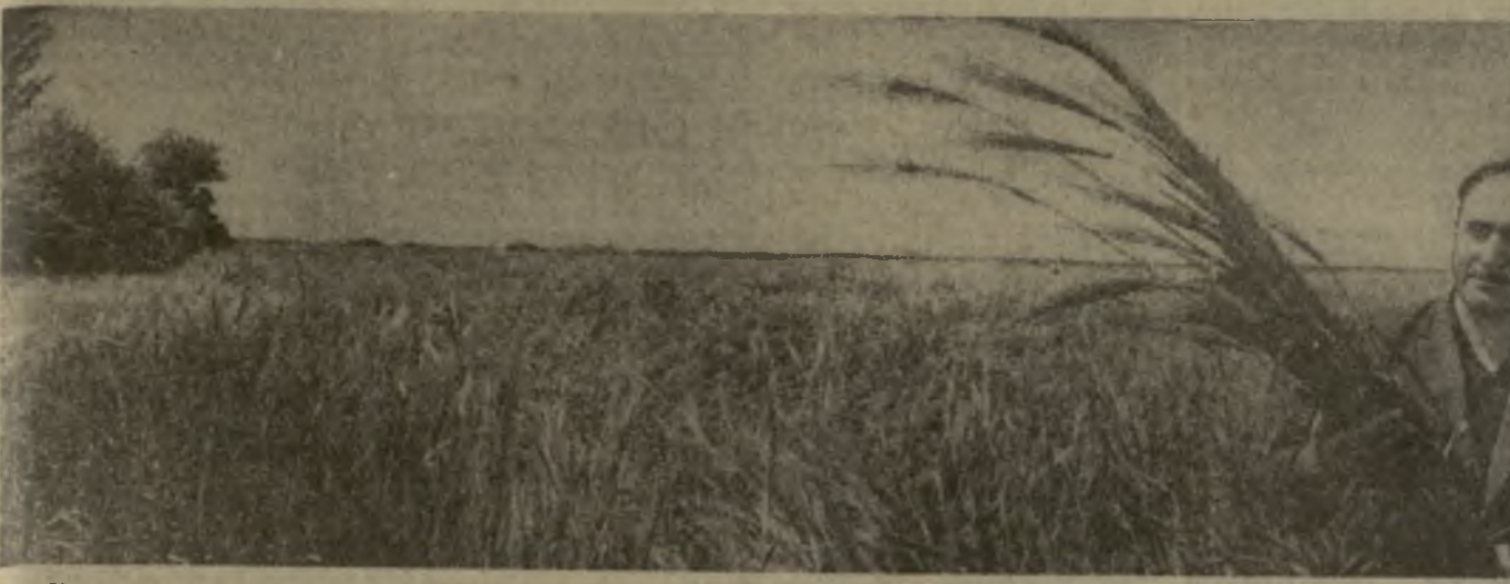
Хороший урожай озимых колосовых культур ожидается в колхозе села Гаганаи Кварельского района. Здесь пшеницей и ячменем занято 1.000 гектаров. Колхозники обязались собрать с каждого гектара по 21 центнеру зерна вместо 17 центнера по плану.

Доклад состоялся 2 июня 1967 года, в актовом зале Грузинского филиала Института марксизма-ленинизма при ЦК КПСС (проспект Руставели № 28). ТБИЛИССКИЙ КОМИТЕТ КОМПАРИИ ГРУЗИИ, ПРАВЛЕНИЕ ТБИЛИССКОЙ ГОРОДСКОЙ ОРГАНИЗАЦИИ ОБЩЕСТВА «ЗНАНИЕ» ГРУЗИНСКОЙ ССР.