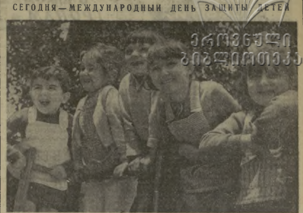
Им принадлежит мир труда, наук и счастья, мир света и безоблачно детства в великой Стране Советов. Радость и счастье детей, чистое небо над их головами берегут все честные люди Земли.