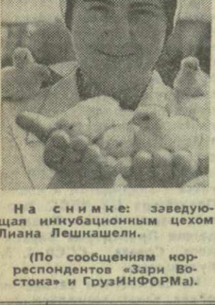
По сообщениям корреспондентов «Зари Востока» и ГрузинформФема.