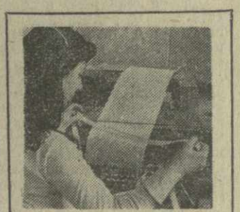
С ТЕЛЕТАЙПНОЙ ЛЕНТЫ

▲ ГУАЯКИЛЬ. В Эквадоре продолжаются массовые протесты трудящихся по поводу расправы полиции над бастовавшими рабочими сахарного завода «Астра», в результате которой убиты десятки людей. Ведущие профсоюзные страны объявили трехдневный траур по погибшим. В совместном заявлении они потребовали сурового наказания виновников преступной атаки.