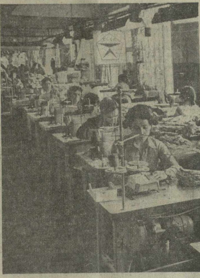
▲ УДАРНО ТРУДИТСЯ в канун 60-летия Великого Октября коллектив Цхинвальской швейной фабрики. На снимке: участок пошивочного цеха № 4. Здесь выпускается продукция, отмеченная государственным Знаком качества.