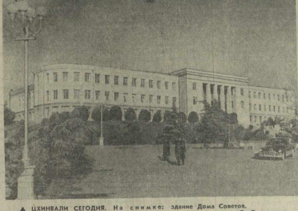
▲ ЦХИВАЛИ СЕГОДНЯ. На снимке: здание Дома Советов.