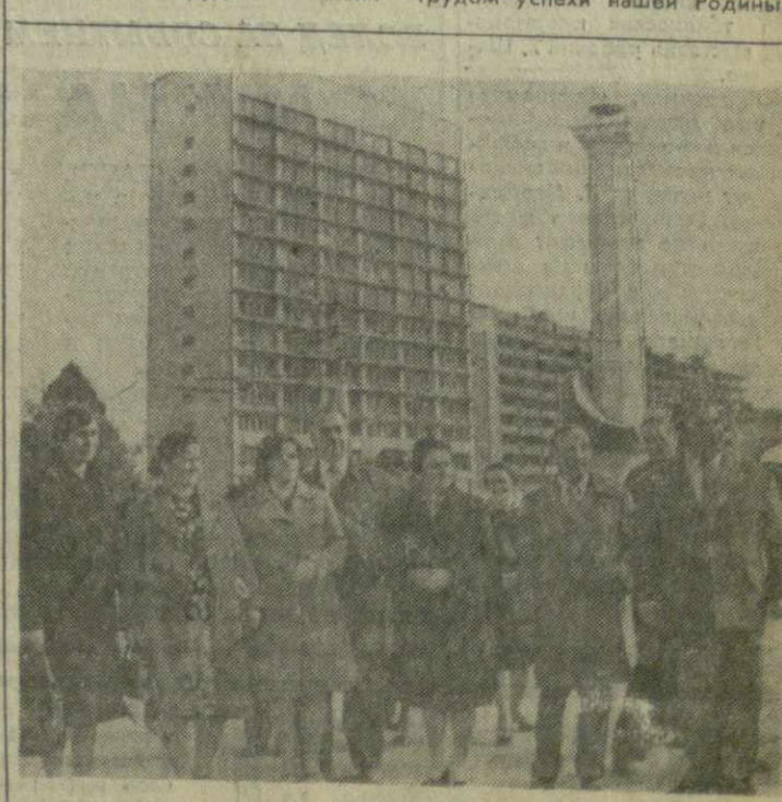
На снимке: участники Дней Аджарской АССР на проспекте И. Чавчавадзе.

Коллектив Батумского педагогического института имени Ш. Руставели делает все для того, чтобы из его стен выходили квалифицированные специалисты, умножающие своим трудом успехи нашей Родины.