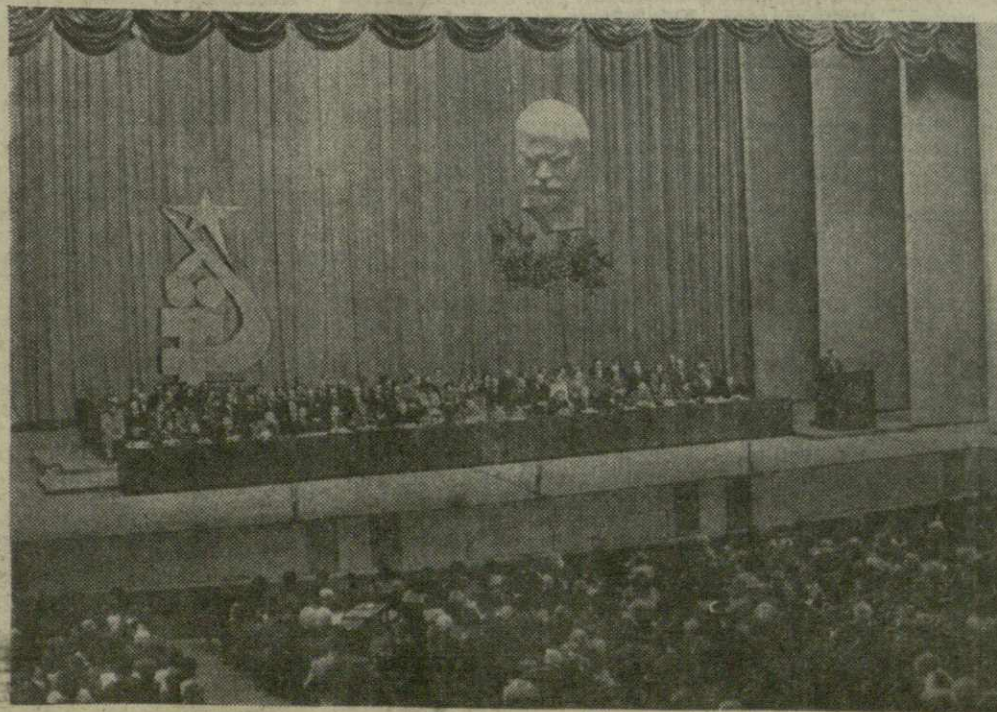
На снимке: во время торжественного вечера.