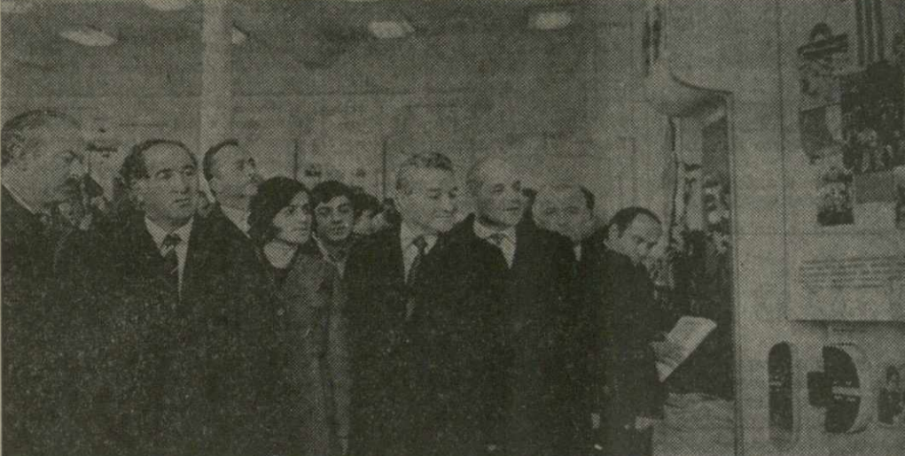
На снимке: участники Дней Адjarской АССР в Тбилиси на ВДНХ Грузинской АССР.

блики встречают знаменательную дату в жизни нашей страны — 60-летие Великого Октября, как оведают рубрики десятой пятилетки. Читатель как бы совершает увлекательное путешествие по чудесному, солнечному краю, знакомясь с его историей, культурой, с трудными буднями машиностроителей и портновов, чаеводов и цитрусоводов, с замечательными здравницами прославленных на всю страну курортов, новостей, о всем том, что создает сегодняшнюю облик тридцати орденосной Советской Адjarии.