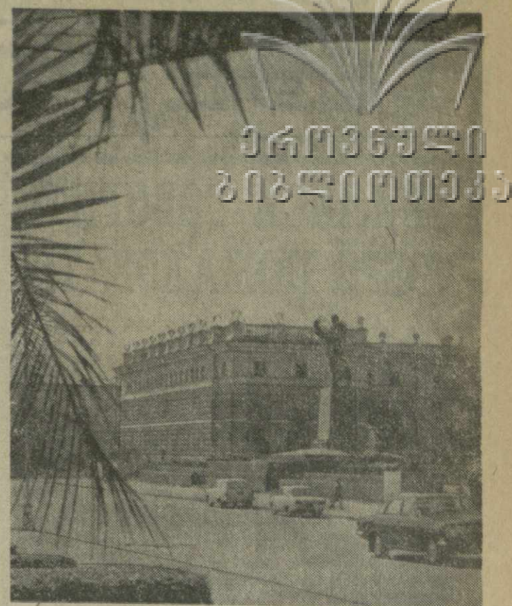
▲ СУХУМИ СЕГОДНЯ. На снимке: площадь Ленина.

СЕГОДНЯ В ТБИЛИСИ НАЧИНАЮТСЯ ДНИ АБХАЗСКОЙ АВТОНОМНОЙ СОВЕТСКОЙ СОЦИАЛИСТИЧЕСКОЙ РЕСПУБЛИКИ