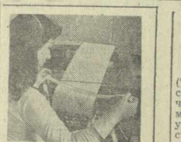
С ТЕЛЕТАЙПНОЙ ЛЕНТЫ