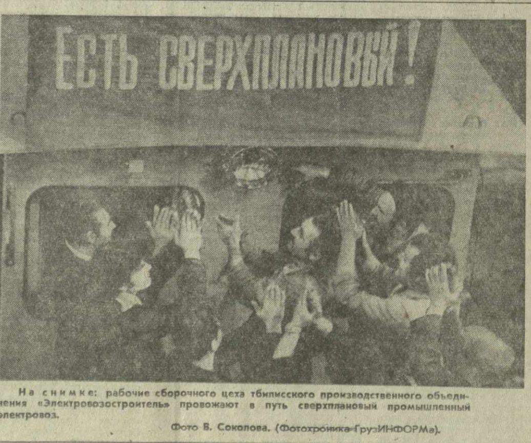
На снимке: рабочие сборочного цеха тбилисского производственного объединения «Электровозостроитель» провозжат в путь сверхплановый промышленный электровагон.