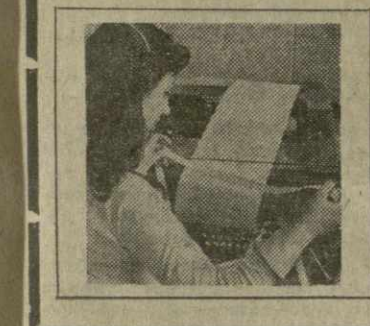
Четвертый год десятой пятилетки можно смело называть решающим этапом в выполнении намеченных XXV съездом КПСС задач. Поэтому особое внимание следует уделить выполнению и перевыполнению

В центральном выставочном зале монгольской столицы открылась фотовыставка «Москва олимпийская». Выставка рассказывает о Москве и москвичах, в строительстве Олимпийской деревни, развитии массовой физической культуры в СССР, о городах, которые в 1980 году примут участников Олимпийских игр.