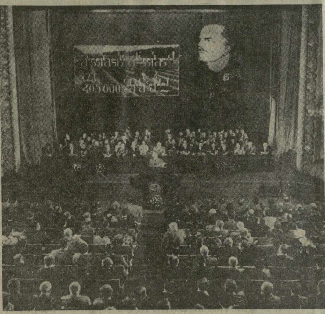
На снимке: в зале собрания.

Вчера лучшие представители славной когорты чаеводов собрались в празднично убранном зале Тбилисского академического театра имени Шота Руставели, чтобы выразить свои мысли и чувства, свое стремление с еще