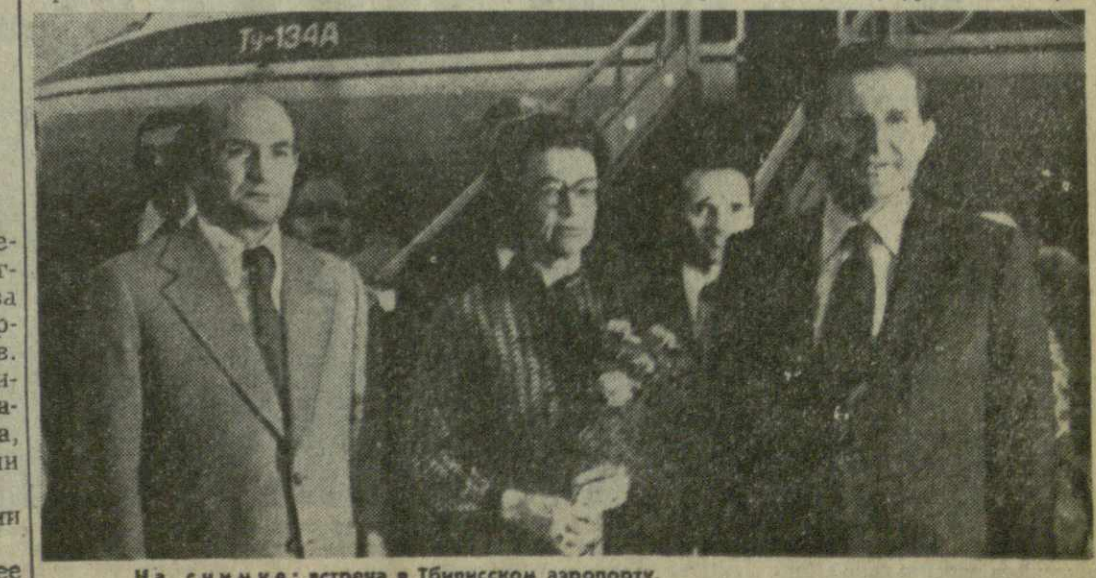
На снимке: встреча в Тбилисском аэропорту.

Председатель Совета Министров Грузинской ССР З. А. ПАТАРИДЗЕ