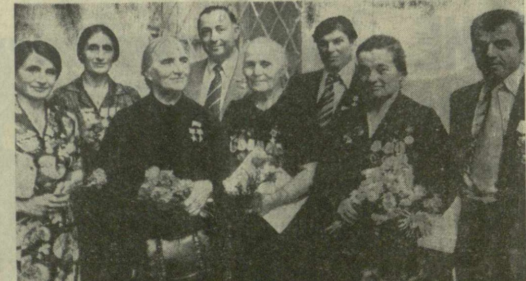
На снимке: группа участников республиканского собрания чаеводов и работников чайной промышленности.

Принято на республиканском собрании чаеводов и работников чайной промышленности с участием представителей партийно-хозяйственного актива Грузинской ССР 24 сентября 1977 года.