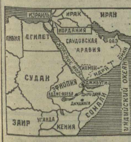
На выжженном бесплодном солнцем каменистом плато Огаден идут ожесточенные бои с применением средств артиллерии и авиации. Огаден — одна из наиболее пустынных провинций на востоке Эфиопии — стал ареной кровопролитных боев между эфиопскими войсками и силами так называемого «фронта освобождения Западного Сомали» (ФОЗС), который поддерживает армия Сомали.

то Огаден идет ожесточенные бои с применением средств артиллерии и авиации. Огаден — одна из наиболее пустынных провинций на востоке Эфиопии — стал ареной кровопролитных боев между эфиопскими войсками и силами так называемого «фронта освобождения Западного Сомали» (ФОЗС), который поддерживает армия Сомали.