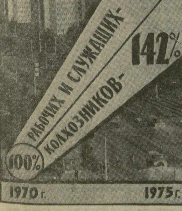
Рост среднемесячной заработной платы за девятую пятилетку (1970 г. — 100%).

Если к моменту принятия постановления по Тбилисскому горкому партии Грузии по многим важнейшим экономическим показателям занимала одно из последних мест в стране и по итогам первых двух лет девятой пятилетки в целом ее задания оказались фактически под угрозой срыва, то за три последующих года положение резко измени-