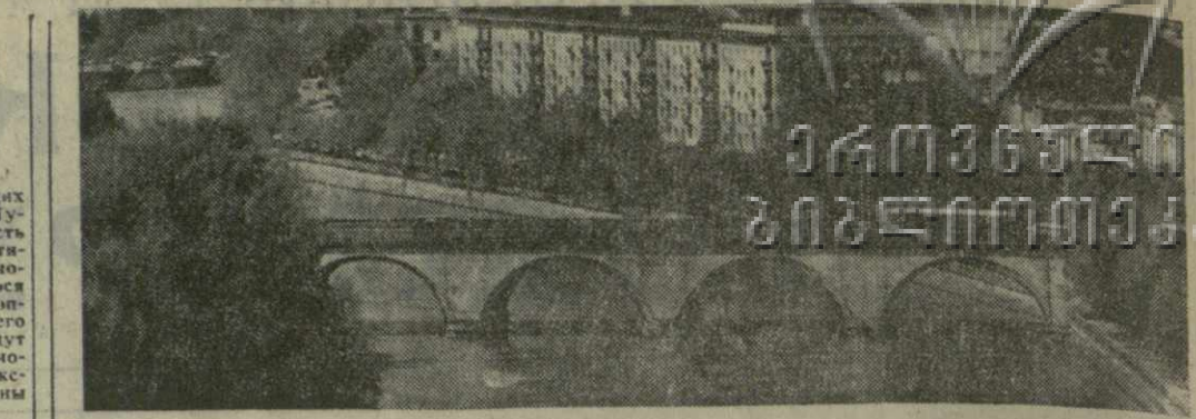
ОДИН ИЗ УГОЛКОВ ТБИЛИСИ.