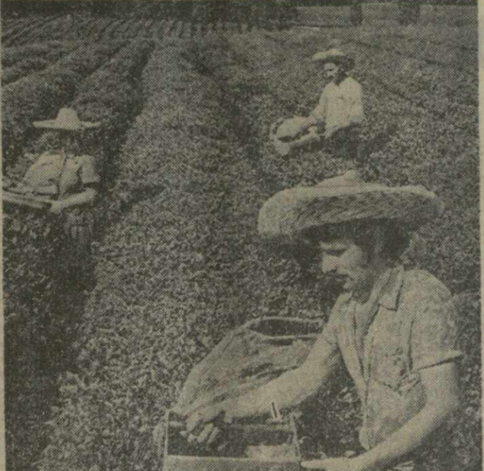
Более 30 процентов чайного листа в Хечерском чайном совхозе Зугдидского района собирается с помощью такой механизации.