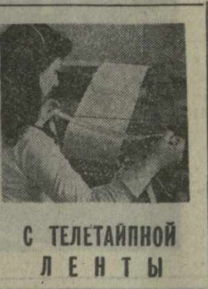
С ТЕЛЕАЙДНОЙ ЛЕНТЫ

Генеральной Ассамблеи ООН по разоружению. В ходе развернувшейся на сессии общей дискуссии обращается внимание на многочисленные факты последнего времени, свидетельствующие о нарастании дискриминации в мировой торговле под влиянием продолжающихся кризисных явлений в экономике капиталистических стран. Представители Советского Союза и других социалистических стран в этой связи указали на необходимость усиления внимания ЮНКТАД к этому серьезному и тревожающему вопросу в свете стоящей перед ним задачи борьбы против дискриминации, неравноправия и всякого рода искусственных ограничений в международной торговле.