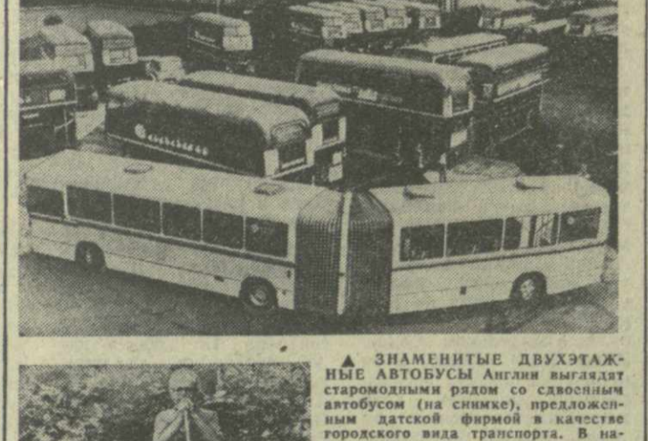
Знаменитые двухэтажные автобусы Англии выйдут в Тбилиси в составе туристической группы.