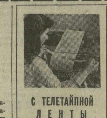
С ТЕЛЕТАЙПНОЙ ЛЕНТЫ