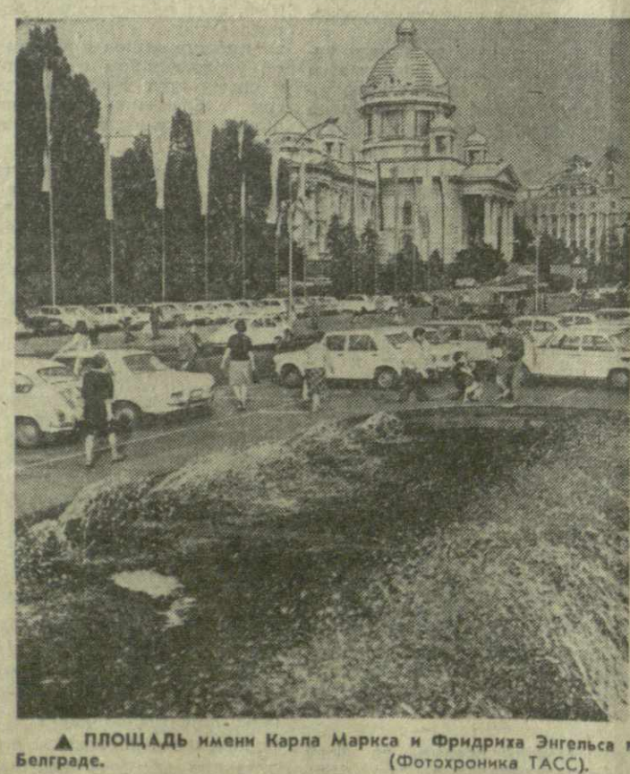
ПЛОЩАДЬ имени Карла Маркса и Фридриха Энгельса в Белграде.

вместных разработках в области строительства высотных плотин. Atlas и каталог полезных диорастущих растений Югославии и Крыма, составленный учеными обеих стран, представляет собой ценный справочник для работников парфюмерной и фармацевтической промышленности. Объединенные усилия советских и югославских ученых, инженеров и техников служат ускорению научнотехнического прогресса в обеих странах. В последнее время это сотрудничество обогащается новыми, весьма перспективными и формами связи. Прежде всего — это прямое межотраслевое сотрудничество советских и югославских ведомств и организаций. Оно вносит весомый вклад в дальнейшее упрочение дружбы между народами Советского Союза и Югославии.