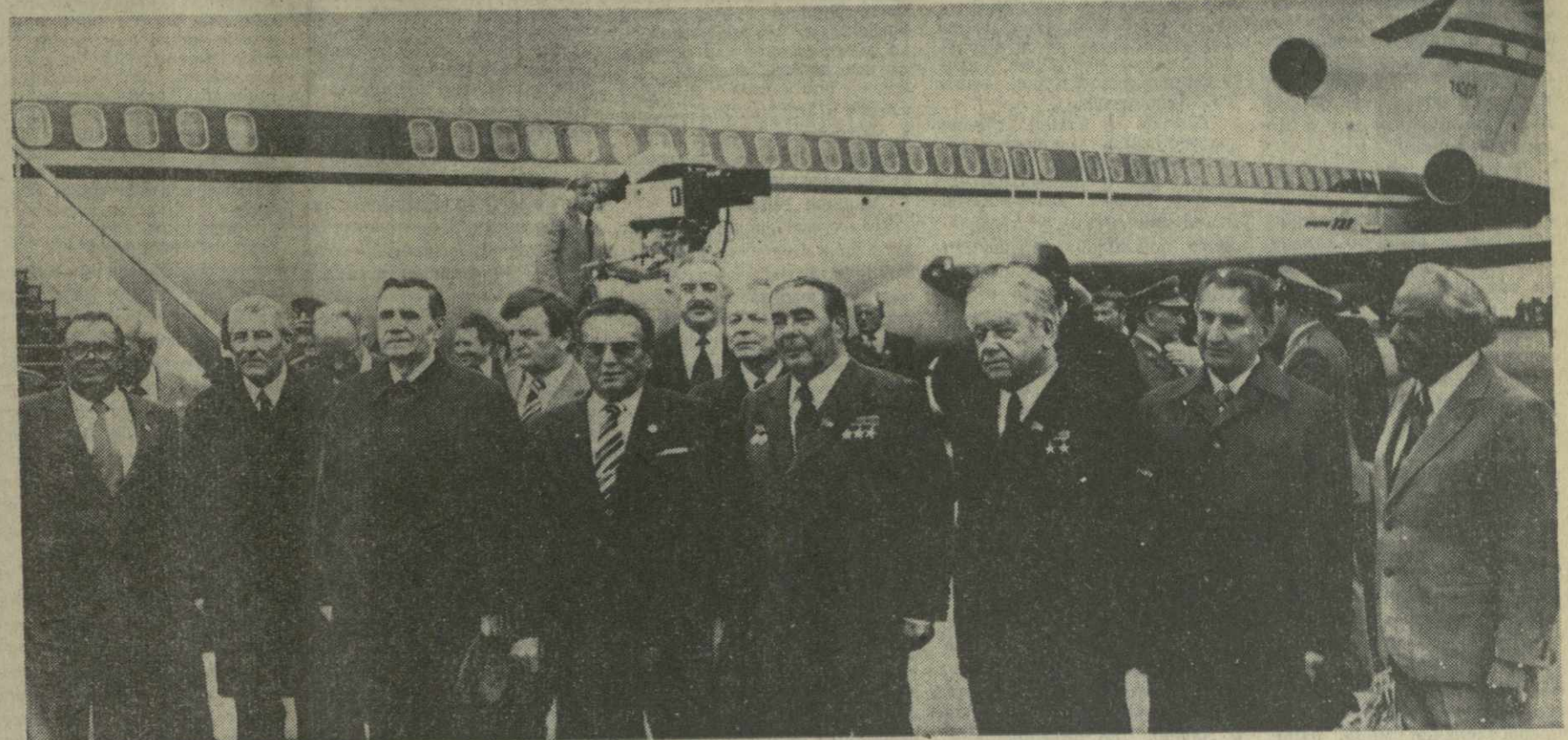
На снимке: во время встречи на аэродроме. (Телефото ТАСС — ГрузинФОРМА).