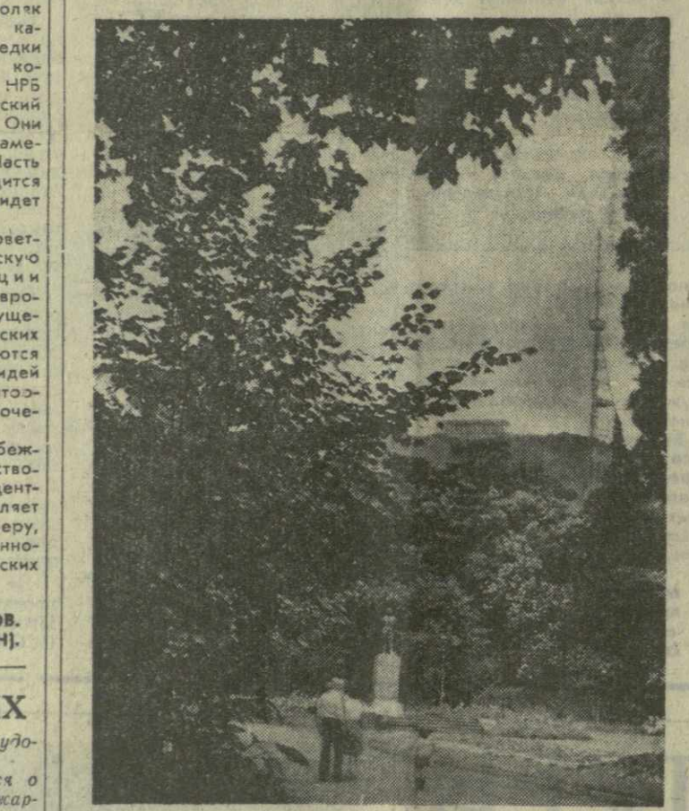
ТБИЛИСИ СЕГОДНЯ. В саду Коммунаров.

В Нью-Йорке закончился традиционный матч по многоборью, где, кроме советских и американских атлетов, выступали также канадские спортсмены. У десятиборьев первое место занял американец Ф. Диксон, набравший 8.392 очка. Рекордсмен Европы А. Гребенюк из Ставрополя вышел на второе место. У него — 8.114 очков. В соревнованиях женщин по программе пятиборья победила Н. Ткаченко из Македвны — 4.666, лишь 23 очка «не дотянувшая» до рекорда СССР, установленного ею в нынешнем сезоне. Набрала 13.263 очка, советские спортсменки заняли первое место. На втором месте спортсменки Канады — 11.427, на третьем — американки — 11.059, выступавшие, правда, без своего лидера Джейн Фредерик. Когда судейская коллегия подсчитала очки, то выяснилось, что в традиционном матче победу одержали женщины сборной СССР и мужская США.