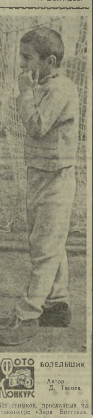
Из снимков, присланных на фотоконкурс «Зари Востока».