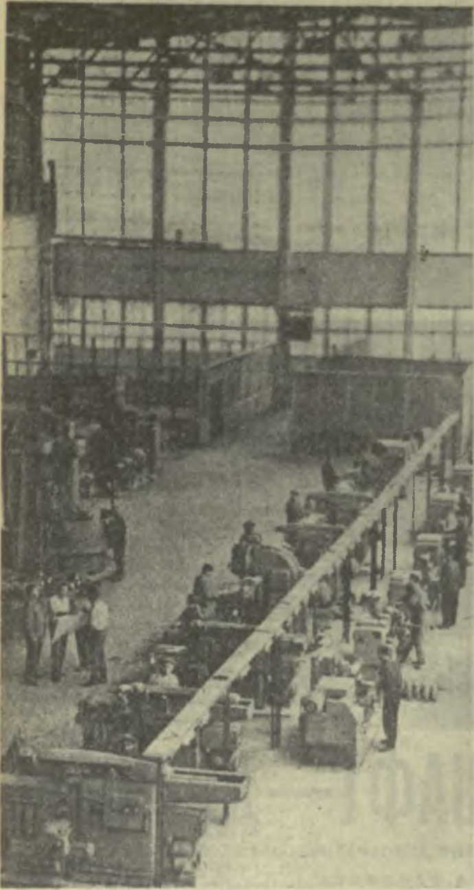
Новую трудовую победу одержали в соревновании за честь 50-летия Великого Октября строители и монтажники, сооружающие Руставский завод металлоконструкций. Недавно был сдан в эксплуатацию первый цех этого предприятия — ремонтно-механический, который и показан на снимке.