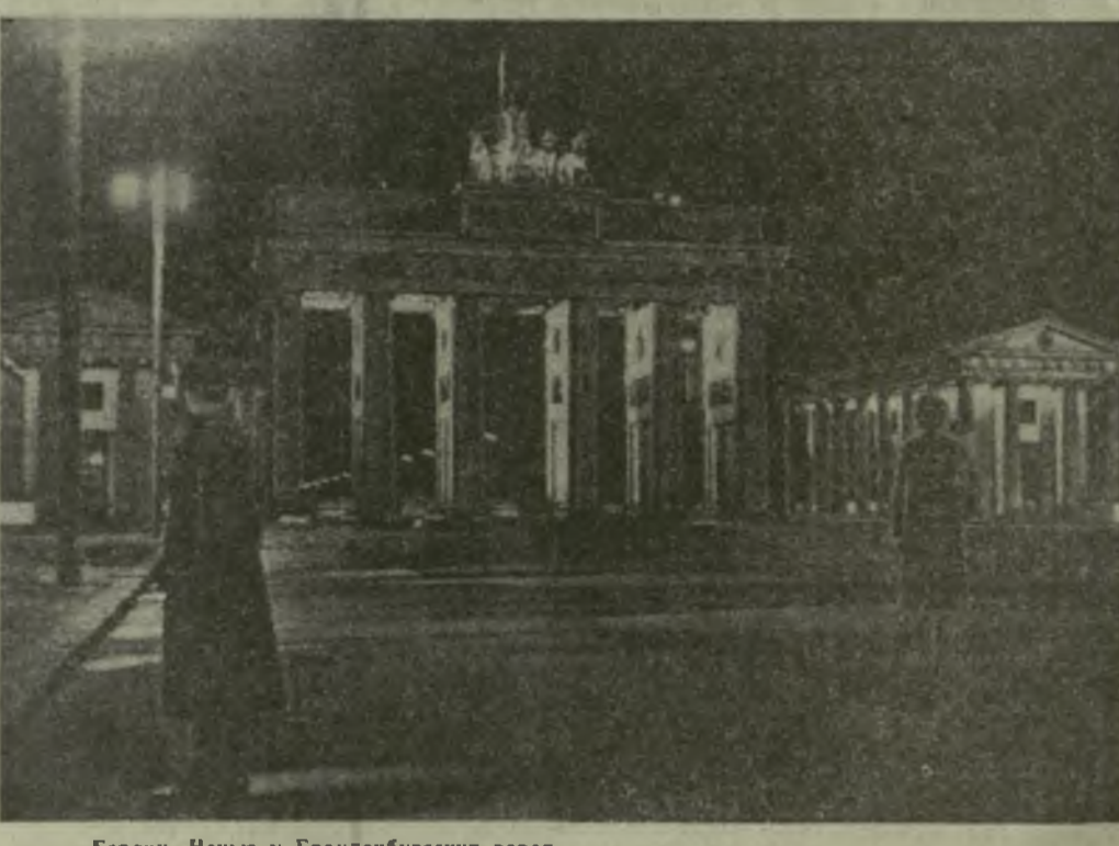
Берлин. Ночью у Бранденбургских ворот.

Китайская официальная печать изо дня в день обращается к своим читателям с многочисленными призывами «горячо любить Освободительную армию, учиться у Освободительной армии». Эти призывы не случайны. Судя по некоторым материалам провинциальных газет, использование Мао Цзэ-дуном и его группой вооруженных сил для подавления своих политических противников вызвало в стране серьезное противодействие.