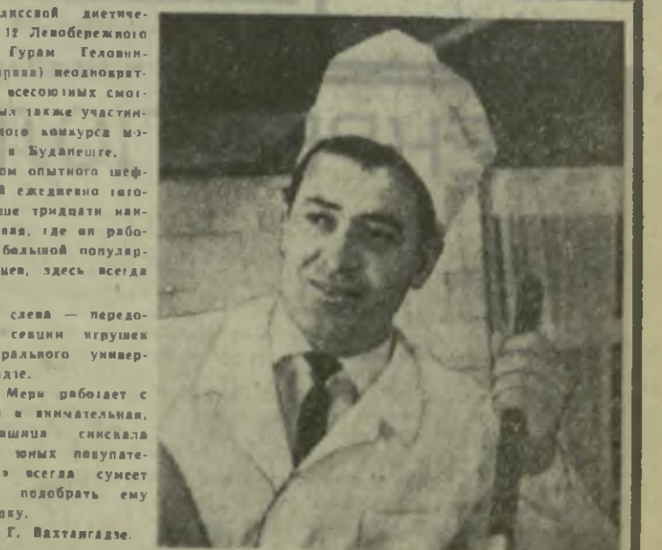
Под руководством опытного шеф-повара в столовой ежедневно готовятся блюда свыше тридцати наименований. Столовая, где он работает, пользуется большой популярностью у тбилисцев, здесь всегда много народу.