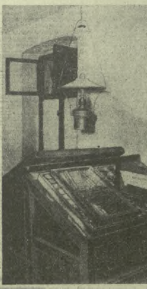
Лейпциг. Типография, где печаталась газета «Искра».