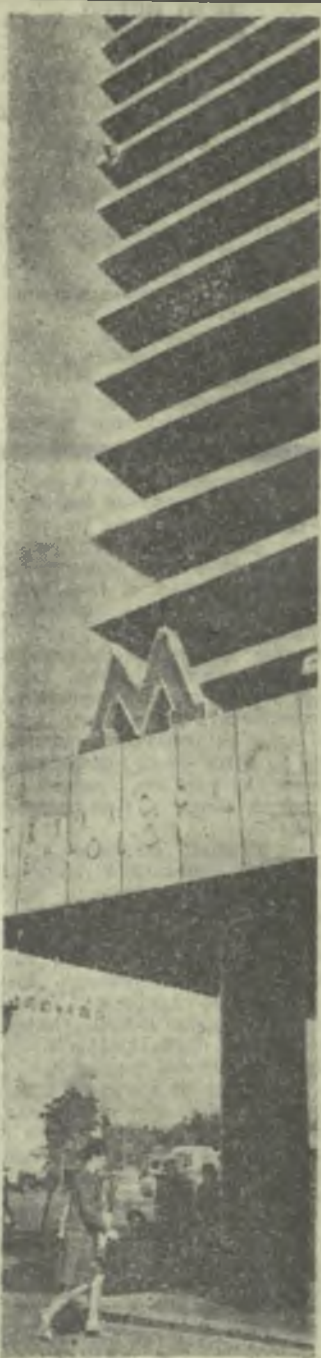
Тбилисский метрополитен. На снимке: вход на станцию «Площадь Вокзальная».