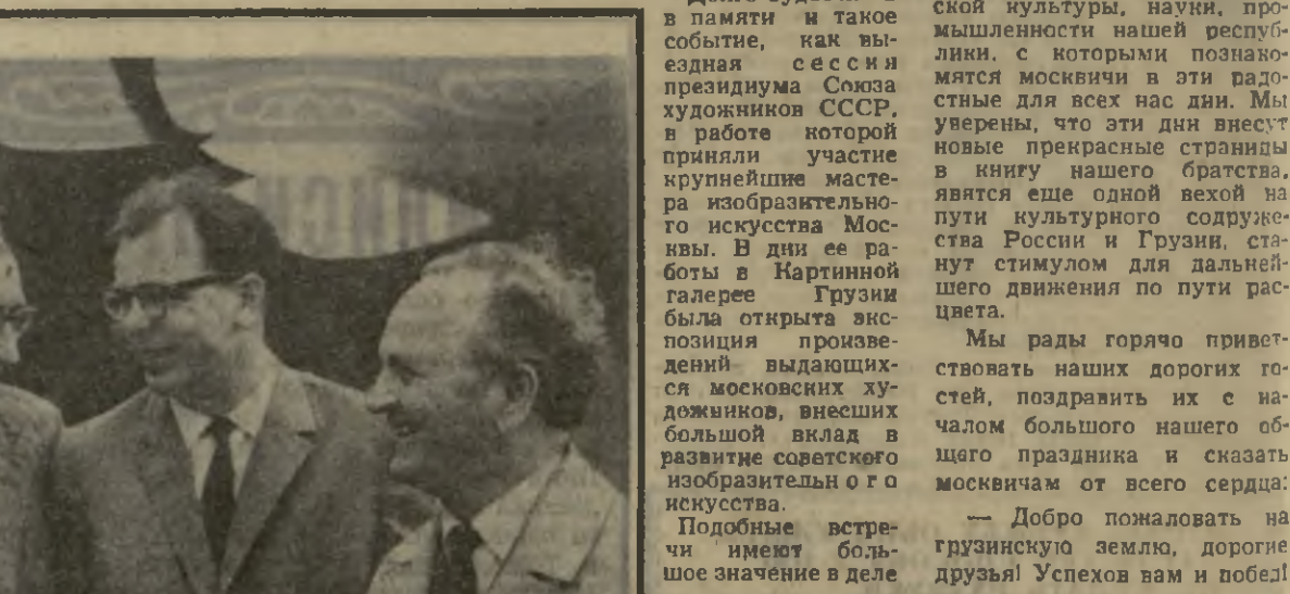
Приезд друзей — это всегда радость. Но особенно радостно встречать собравшихся по творчеству. Дружба русских и грузинских деятелей музыкальной культуры имеет давние богатые традиции.

Тбилисцы любят и знают русскую музыку. Вот почему они с нетерпением ждут встреч с такими замечательными коллективами, как Государственный симфонический оркестр Союза ССР, Государственный академический хор Союза ССР под руководством народного артиста СССР А. Свешникова, и с целым рядом других видных исполнителей и вокалистов.