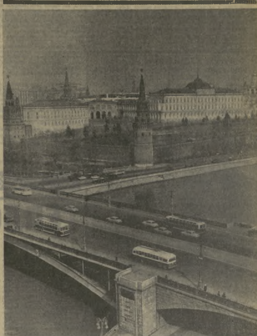
Москва — столица нашей Родины.

Начинающиеся Дни Москвы в Тбилиси — новое свидетельство неразрывной дружбы русского и грузинского народов. И принимая сегодня посланцев на земле столицы Грузии, мы говорим: — Добро пожаловать, дорогие братья! Пусть крепнет и ширится наша дружба во имя самого светлого, что объединяет нас, — во имя строительства коммунизма в нашей стране.