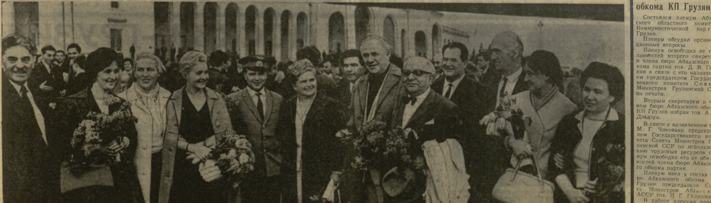
Встреча московских друзей в Тбилисском аэропорту.

ЧТОБЫ ДРУЖБУ ОБНАРУЖИТЬ, ЕСТЬ ТРИ СПОСОБА У НАС: НЕ ЖЕЛАТЬ РАЗЛУКИ С ДРУГОМ, БЫТЬ С НИМ ВМЕСТЕ, ЭТО РАЗ, ВО-ВТОРЫХ, ДАРИТЬ ОТ СЕРДЦА — БЕЗ РАЗДУМЬЯ И ПРИКРАС, В-ТРЕТЬИХ, РИНУТЬСЯ НА ПОМОЩЬ, ИЗДАЛЕКА В ТРУДНЫЙ ЧАС. Шота РУСТАВЕЛИ.