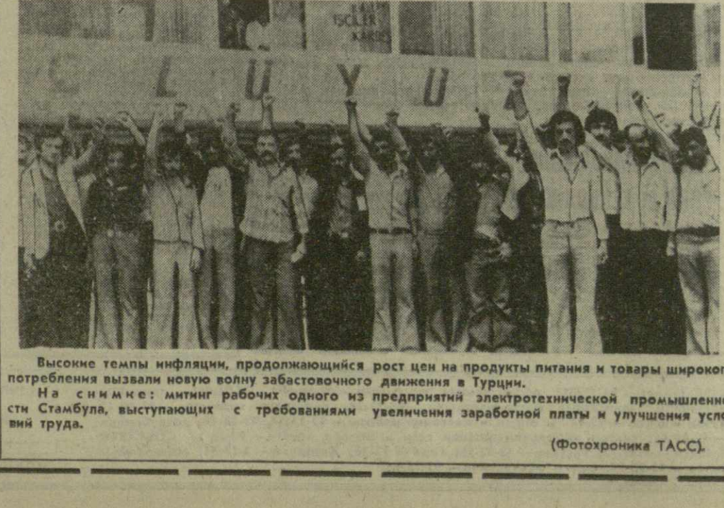
Высокие темпы инфляции, продолжающийся рост цен на продукты питания и товары широкого потребления вызвали новую волну забастовочного движения в Турции.

ДРУЖБА — НА ВСЕХ ЯЗЫКАХ В Батуми завершил работу интернациональный студенческий строительный лагерь «Дружба». Пятью к плечу со своими грузинскими сверстниками в течение 20 дней трудились здесь студенты — бойцы строительных отрядов из Болгарии, ГДР и Чехословакии. Сводная интернациональная дружина работала на ударных объектах города и близлежащих районов. Каждый день лагерь был отмечен ударным, самоотверженным трудом студентов. В настоящее время заручившись участниками интернационального студенческого строительства Грузии, с жизнью комсомольцев, молодежи республики, болгарские студенты выехали к своим друзьям в Кутаиси, в их хостеловские и невыевшие коллеги прибыли в Тбилиси. (ГрузинФОРМ). Н. СТРЕЛЬЦОВА. (АПН).