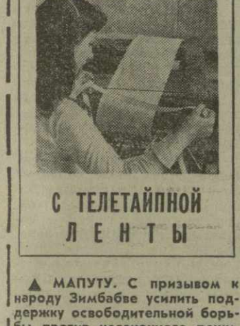
С ТЕЛЕТАЙПНОЙ ЛЕНТЫ

ФРГ: РОСТ ГОНКИ ВООРУЖЕНИЙ БОНН, 10 августа. (ТАСС). Военно-промышленные круги ФРГ наращивают темпы гонки вооружений. Никогда еще военная промышленность ФРГ не имела так много заказов, как теперь, подчеркивает западногерманский журнал «Виртшафтсвель». Десятилетняя программа министерства обороны ФРГ по закупкам боевой техники и вооружения предусматривает поставки Bundeswehre 322 самолетов «Торнадо» и 175 «Альфа-джет», 432 зенитных самоходных установок «Гелард» и 140 зенитно-ракетных систем «Роланд», 1.800 танков «Леопард-2» и другой техники. Все это обойдется западногерманским налогоплательщикам почти в 100 миллиардов марок. «Голом оружейного бума» называет 1977 год газета профсоюзов «Вельт дер арбайтер». Этим бумом спешат воспользоваться более 20 западногерманских фирм, производящих оружие. Однако уже сегодня концерны не довольствуются только заказами Bundeswehre, для них стал тесен рынок сбыта в других странах НАТО. Западногерманские торговые оружейные ухищряются найти сбыт своей смертоносной продукции через третьи страны. На многочисленных демонстрациях, состоявшихся в дни в более чем 40 городах ФРГ, западногерманская прогрессивная общественность во весь голос заявила протест против дальнейшей гонки вооружений. В знак благодарности Телави избрала Кетеван Мераваеву Почетной грамотой. (ГрузинФОРМ).