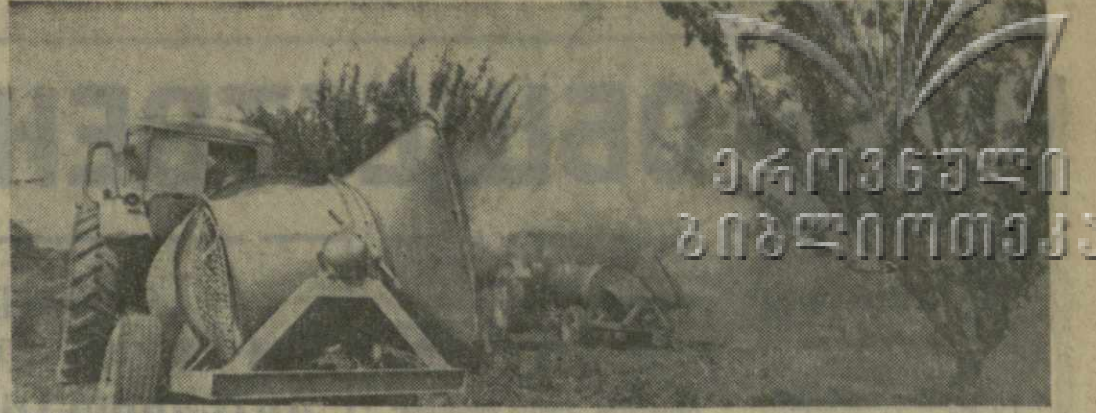
▲ НА 1.400 ГЕКТАРАХ раскинулись фруктовые сады Брестского плодородного совхоза Карельского района. 1.200 из них — плодосады. Труженики совхоза рассчитывают в юбилейном году продать государству 11 тысяч тонн семечковых и косточковых плодов. Это на пятую тонн больше задания.

Орган ЦК КП Грузии, Верховного Совета Грузинской ССР и Совета Министров Грузинской ССР № 179 (15851) • ВТОРНИК, 2 АВГУСТА 1977 ГОДА • Цена 2 коп.