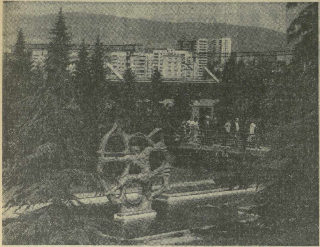
▲ ТБИЛИСИ СЕГОДНЯ. На снимке: вид на станцию метро «Дидубе».