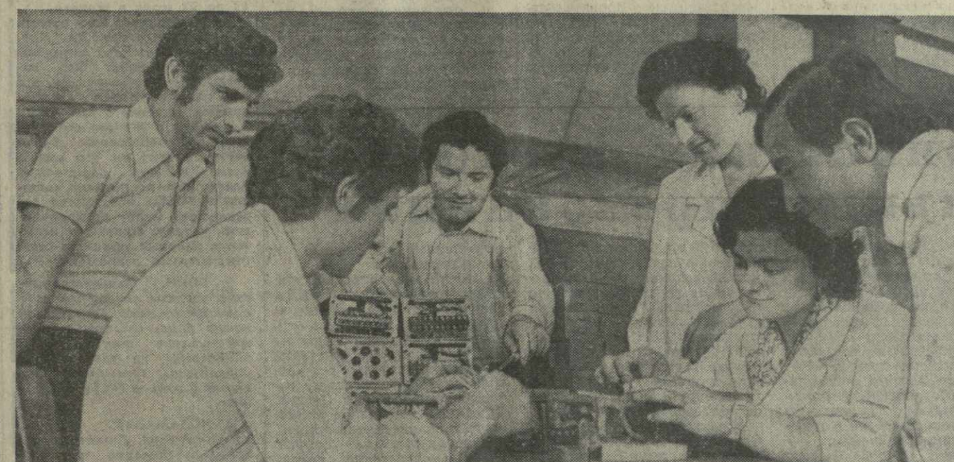
▲ НАДЕЖНЫМИ ПОМОЩНИКАМИ партийной организации завода «Сухумприбор» рекомендовали себя народные контролеры.