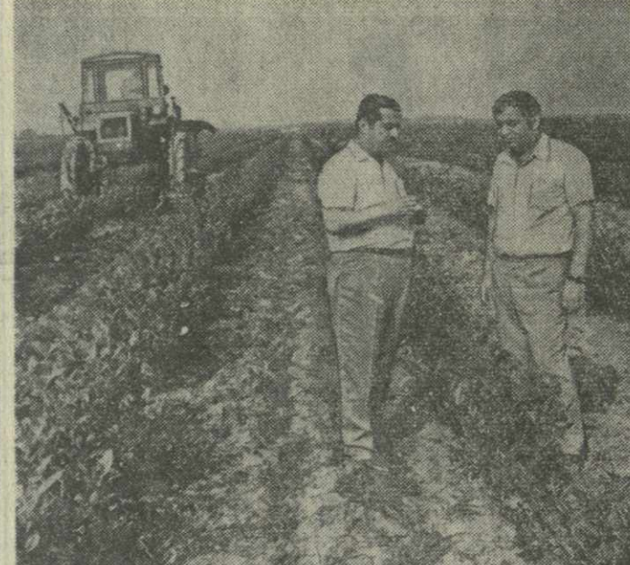
▲ В КВМО-БАРГЕБСКОМ СОВХОЗЕ Гальского района на 45 гектарах раскинулись молодые плантации чая, заложенные три года назад высокоурожайным клоном «Анасули-1». В нынешнем году плантации дают первый урожай сортового чайного листа. Баргебцы рассчитывают получить с них не менее ста тонн сырья.

В докладе и выступлениях отмечалось, что высокая поли-