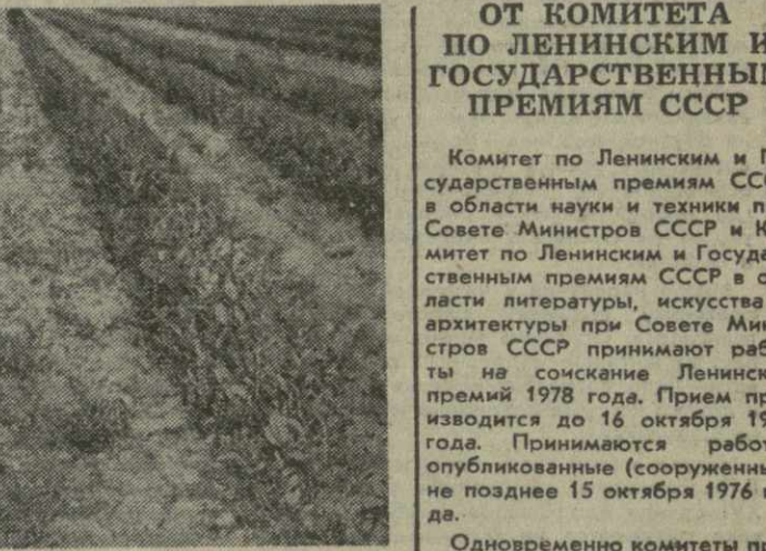
▲ В КВМО-БАРГЕБСКОМ СОВХОЗЕ Гальского района на 45 гектарах раскинулись молодые плантации чая, заложенные три года назад высокоурожайным клоном «Анасули-1».

Теперь в стадии проектирования можно определить, в ка-