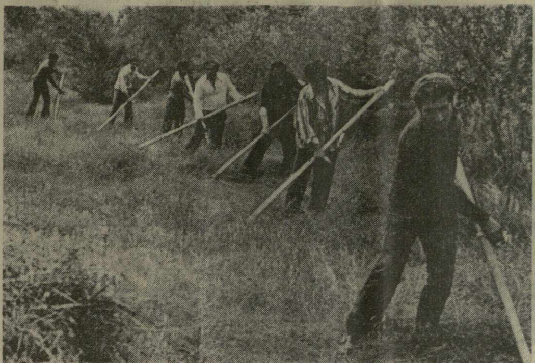
УСПЕШНЫМИ ДЕЛАМИ встречают юноши и девушки нашей республики свой праздник — День советской молодежи. Участвуя во всевозможном комсомольском субботнике, рабочие и служащие столицы республики оказывают помощь труженникам Ганчанского молочно-овощного совхоза Гардабанского района в заготовке кормов для скота. На снимке: соенокос в Ганчанском молочно-овощном совхозе.