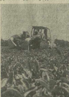
На снимке: «Самрест» ведет сбор листа на чайных плантациях Кобулетского овцеводческого совхоза.

Пятая бригада Кобулетского овцеводческого совхоза, которой поручено возделывание и сбор чая, работала о досрочном выполнении полугодового задания.