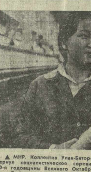
МНР. Коллектив Улан-Баторской ковровой фабрики развлекли социалистическое соревнование за достойную встречу 60-й годовщины Великого Октября.

ЖЕНЕВА. Состоялась очередная встреча делегаций СССР и США на проходящих здесь советско-американских переговорах.