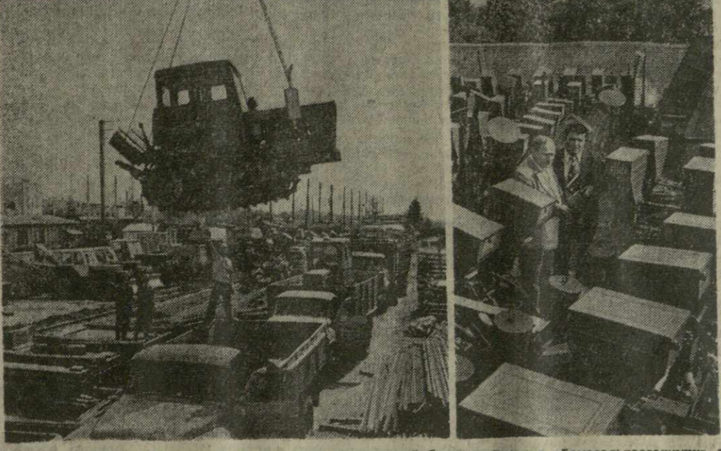
▲ КОЛЛЕКТИВ Кутанской материально-технической базы снабжения «Грузсельхозтехника» с начала нынешнего года заез общестроительным хозяйствам в централизованном порядке 142 автомашин, 109 тракторов, 15 экскаваторов, 205 плугов, 418 сеялок.

Партийные, советские, профсоюзные, комсомольские, хозяйственные организации республики должны создать все условия для того, чтобы трудовое лето студентов и школьников стало максимально плодотворным, способствовало трудовой закалке, идейно-политическому воспитанию молодежи.