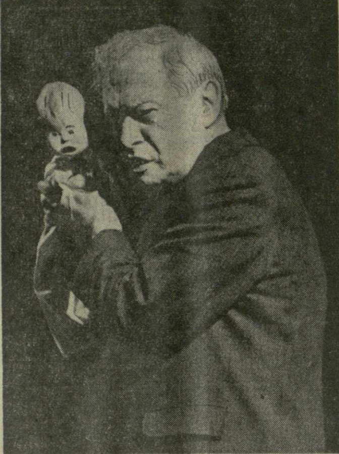
На снимках: театральная общественность Тбилиси приветствует С. Образцова; выступает Сергей Образцов.