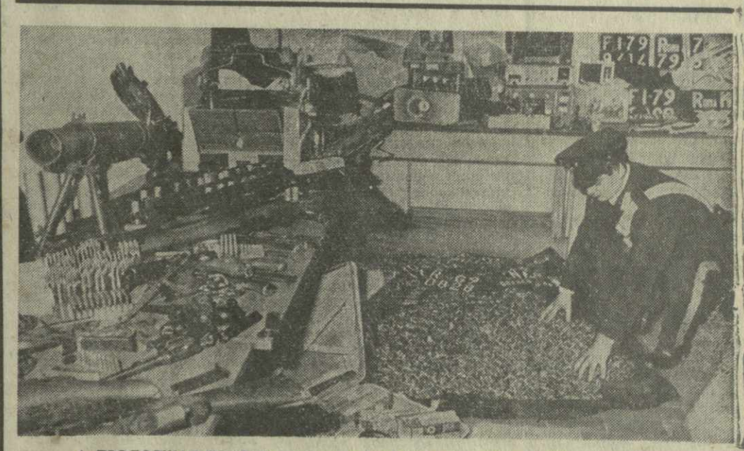
ПРОДОЛЖАЯ ПОИСКИ позитивителей и убийц Альдо Моро, итальянская полиция обнаружила недалеко от Рима еще одну тайную базу оружейных организаций.

НЬЮ-ЙОРК. Государственный секретарь США С. Вэнс встретился с министром иностранных дел Китая Хуан Хуа. Как заявил представитель госдепартамента, переговоры затронули широкий круг вопросов.