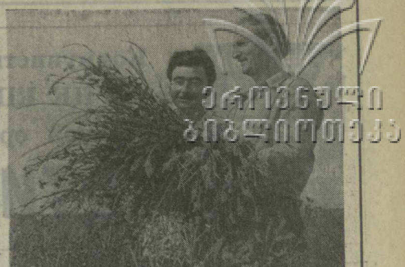
▲ УДАРНЫМ ТРУДОМ отавая на решении майского Пленума ЦК КПСС и июньского пленума ЦК КП Грузии, коллектив Шахшевского совхоза Горьковского района добивается высоких производственных результатов. Особенно успешно трудятся в эти дни кормодобытчики совхоза. Уборка трав здесь ведется четко и организованно. Решено заготовить более двух тысяч тонн сенажа. Это позволит труженикам фермы в зимние месяцы обеспечить животноводство ценным кормом.

შპრი 3 მოვლია სამეცნიერო ინსტიტუტში, სადაც ხდება მასობრივი სამუშაო და მასობრივი განათლების ხარისხების ამაღლება