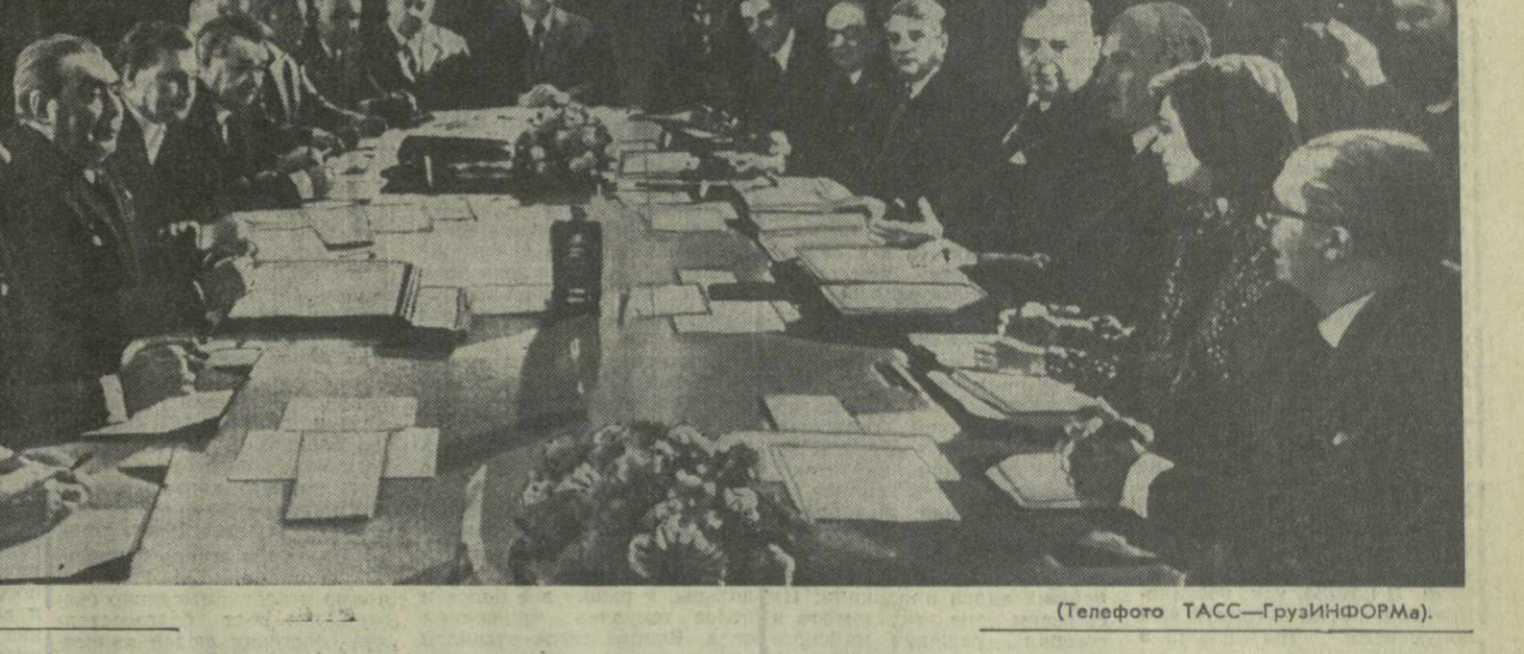
Во время переговоров.

РАМБУЭ. 20 июня. (ТАСС). Во второй половине дня здесь начались переговоры Генерального секретаря ЦК КПСС. Премьер-министра Советского Союза Л. И. Брежнева с Президентом Французской Республики В. Жискар д'Эстэн.