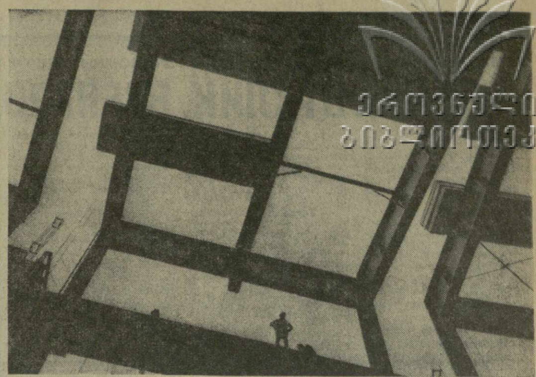
Где-то там, наверху, плывут к арочной плотине Ингуриской ГЭС многотонные бадьи с бетоном. На мгновение зависнув в створе блоков, резко идут они вниз, и очередные кубометры высокопрочного бетона тяжело ложатся в стальную клетку блока.