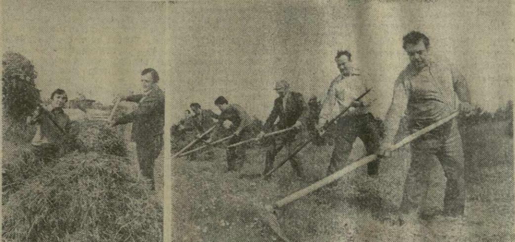
Более 320 коллективов промышленных предприятий и организаций Тбилиси вышли вчера на сенокос. На снимке: труженики Ленинского района города Тбилиси — на сенокосе в окрестностях Тбилисского моря.