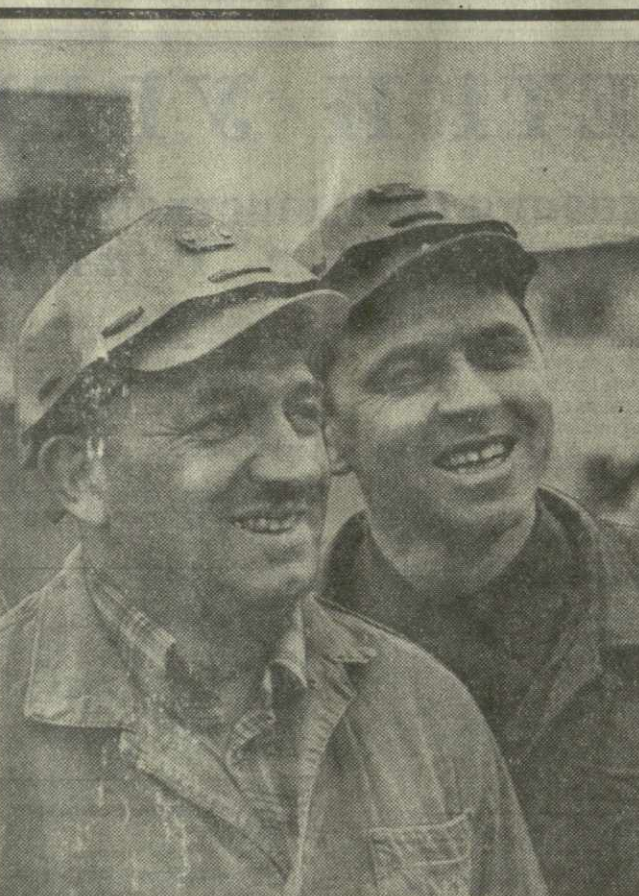
▲ УДАРНО ТРУДИТСЯ НА ПРЕДМЯСНОЙ ВАХТЕ коллектив рудоуправления Ахали Итхвиси горнорудного комбината «Чхатурмарганец». К празднику Первого мая горняки решили поработать о выполнении полугодового задания.

В результате невыполнения планов реализации про-