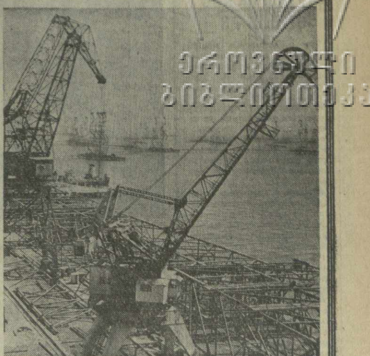
▲ НА 20 ТЫСЯЧ РУБЛЕЙ реализовал сверхплановых изделий с начала года Бакинским машиностроительным завод имени Октябрьской революции, который вносим весомый вклад в освоение глубин Каспия. Он выпускает стальные остовы, предназначенные для бурения разведочных скважин на глубоких участках моря. На снимке: на монтажной площадке завода.

Сегодня, в день 58-й годовщины Советского Азербайджана, трудящиеся нашей республики вновь присягают на верность родной Коммунистической партии, великим ленинским идеям, заверяют, что отдадут все свои силы борьбе за дело коммунизма.