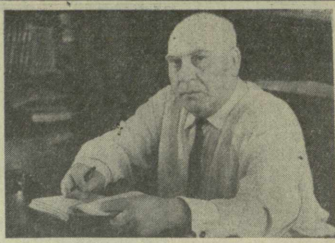
Исполнилось 75 лет со дня рождения известного грузинского поэта Алю Мирцхулава. Предлагаем вниманию читателей два его стихотворения.