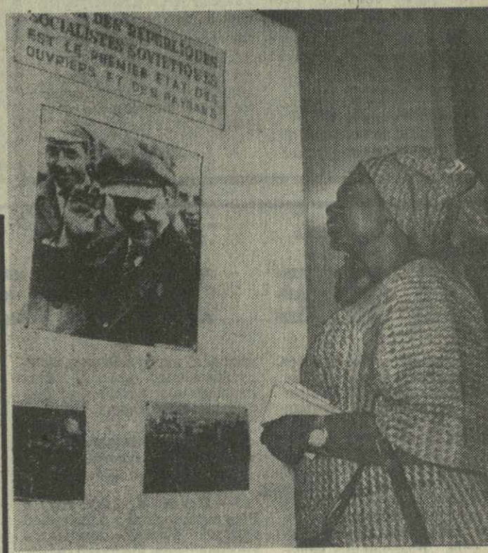
Народ Тоголезской Республики проявляет огромный интерес к Советскому Союзу, его истории и развитию. Во многих учебных заведениях введено изучение русского языка.

На снимке: жители столицы страны — Ломе знакомятся с советской фототехникой.