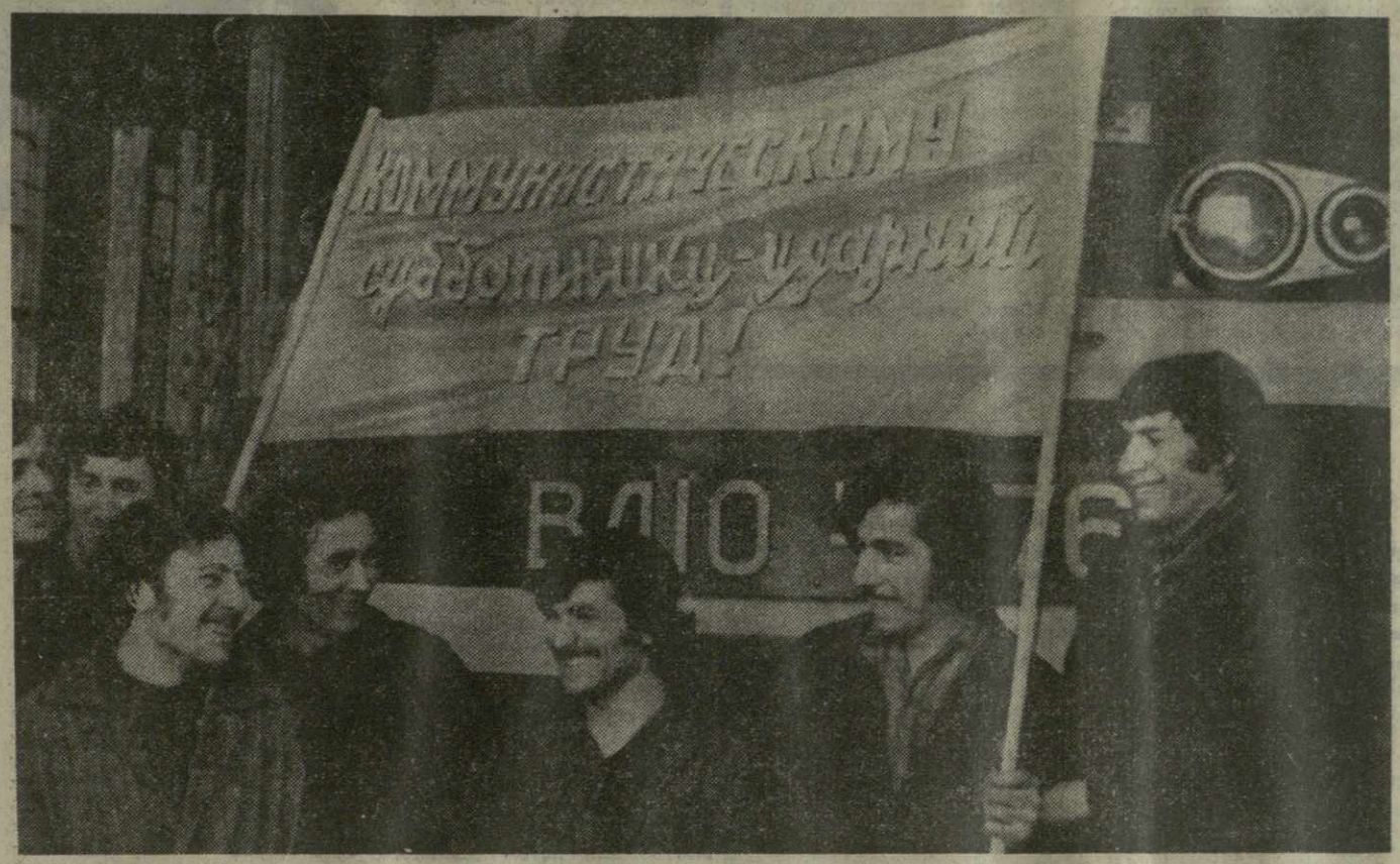
▲ КОЛЛЕКТИВ Тбилисского электровозостроительного завода имени В. И. Ленина детально готовится к коммунистическому субботнику. Трудятся за все производство, выпущенной предприятием 22 апреля, будет изготовлено из сэкономленных материалов. В субботнике примут участие 3.760 электровозостроителей.

Организовано выйдут на субботник труженники Гремского, Кварельского, Ахалского, Мтсидзинского совхозов, колхозов сел Гавизи, Шидла, а всего по району — 20 тысяч человек (ГрузИНФОРМ).