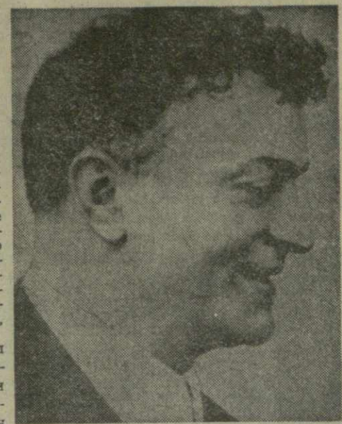
Этими качествами и обладал Сандро Ахметели.

В программе режиссерского факультета, на котором я учился в Московском театральном институте, Ахметели занимал особое место, в ряду других известных режиссеров. Нам часто приводили для примера сцены из его спектаклей. Так, известный советский режиссер А. Д. Попов давал высокую оценку таланту Ахметели. По мнению Попова, «умение находить новые формы, точный ритм спектакля и достижение целостности является делом избранных. Именно в этом заключается сила таланта, суть режиссерского искусства».