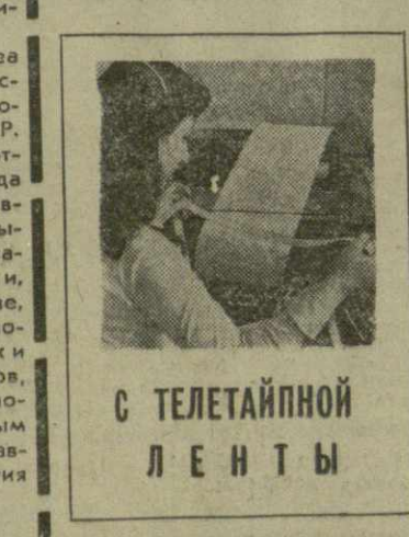
С ТЕЛЕТАЙПНОЙ ЛЕНТЫ

В этот день, пишет газета «Аль-Баас», увеличилась успехом многолетняя борьба сирийских патриотов против французских колонизаторов, и страна обрела подлинную политическую независимость, в борьбе за осуществление прогрессивных социально-экономических преобразований.