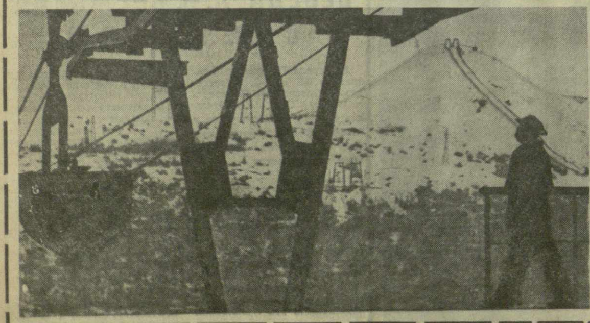
«ГОСУДАРСТВО ЗАБОТИТСЯ ОБ УЛУЧШЕНИИ УСЛОВИЙ И ОХРАНЕ ТРУДА, ЕГО НАУЧНОЙ ОРГАНИЗАЦИИ, О СОКРАЩЕНИИ, А В ДАЛЬНЕЙШЕМ И ПОЛНОМ ВЫТЕСНЕНИИ ТЯЖЕЛОГО ФИЗИЧЕСКОГО ТРУДА НА ОСНОВЕ КОМПЛЕКСНОЙ МЕХАНИЗАЦИИ И АВТОМАТИЗАЦИИ ПРОИЗВОДСТВЕННЫХ ПРОЦЕССОВ ВО ВСЕХ ОТРАСЛЯХ НАРОДНОГО ХОЗЯЙСТВА» — ТАК ГЛАСИТ СТАТЬЯ 21 КОНСТИТУЦИИ ГРУЗИНСКОЙ ССР.

Каждый согласится, что расширение сети лечебных учреждений лишь наполнит решая проблему охраны здоровья населения. Главное — высококвалифицированные, преданные своему делу медицинские кадры. К сожалению, случаи нарушения врачебной этики, невинимательного, халатного отношения к больным в нашей практике не так уж редки. Вот почему одна из важнейших задач нашего министерства — наведение должного