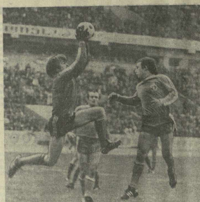
Тбилиси снова порадуят любителей футбола красивой результативной игрой.