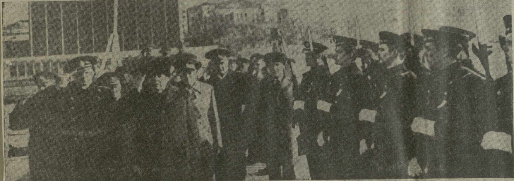
На снимке: на крейсере «Адмирал Сенявин».

ки строительству и наше объединение. Пересмотрев в начале года свои возможности, труженики Даркветского производственного объединения строительствоматериалов решили за счет внутренних резервов производства добиться досрочной отгрузки своей продукции, ежемесячно отправлять на стройку не менее 18 тысяч кубометров высококачественного песка. Слово свое даркветцы держат твердо: в первом квартале 1978 года в адрес ингурских гидростроителей отправлено 54.800 кубометров песка — на сотни кубометров больше, чем было предусмотрено заданием.