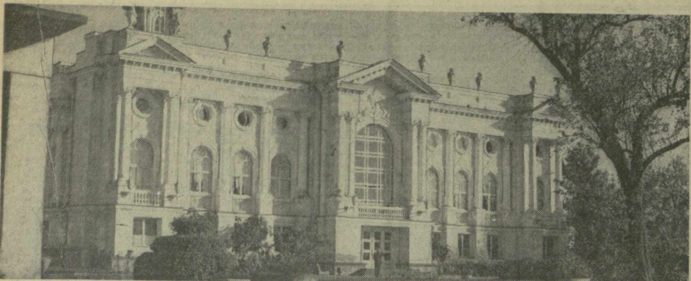
▲ ЦХАКАЯ СЕГОДНЯ. На снимке: здание театра.