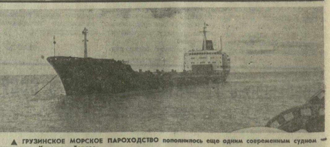
▲ ГРУЗИНСКОЕ МОРСКОЕ ПАРОХОДСТВО пополнилось еще одним современным судном — рудовозом «Художник Тондзе». Построен он на болгарском судостроительном заводе имени Георгия Димитрова в городе Варна. На снимке: новый рудовоз.

На борту спутника установлена научная аппаратура, предназначенная для продолжения исследований в области космического пространства. Аппаратура работает нормально. Координационно-вычислительный центр ведет обработку поступающей информации. (ТАСС).