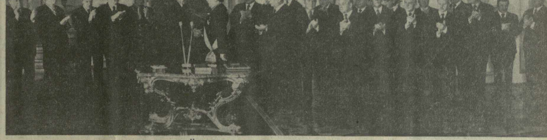
На снимке: во время вручения награды. (Телефото ТАСС — ГрузИНФОРМА).

Среди встречавших находился посол ПНР в СССР Э. Нофак. (ТАСС).