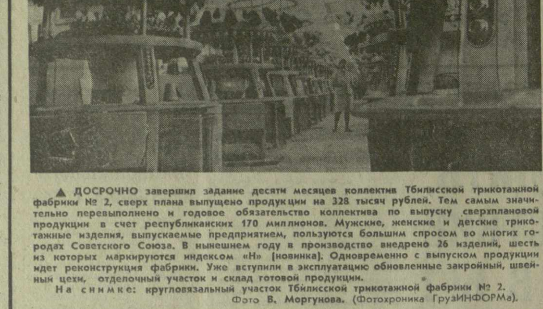
▲ ДОСРОЧНО завершил задание десяти месяцев коллектив Тбилисской трикотажной фабрики № 2, сверх плана выпущено продукции на 328 тысяч рублей. Тем самым коллектив перевыполнил и годовое обязательство коллектива по выпуску сверхплановой продукции в счет республиканских 170 миллионов. Мужские, женские и детские трикотажные изделия, выпускаемые предприятием, пользуются большим спросом во многих городах Советского Союза. В нынешнем году в производство выдано 26 изделий, шесть из которых маркируются индексом «Н» (новинка). Одновременно с выпуском продукции идет реконструкция фабрики. Уже вступили в эксплуатацию обновленные закройный, швейные цехи, отделочный участок и склад готовой продукции.

Рост производительности труда зависит от многих факторов. Немаловажно и значение среди них имеет забота о быте. В отчетный период партийная организация уделила большое внимание вопросам улучшения культурно-бытовых условий рабочих и служащих. Были своевременно отремонтированы жилые дома, рабочие столовые и ледники. Отмечая это, коммунисты, однако, подчеркивали, что в работе столовой и продовольственной магазина есть еще немало недостатков. Очень беден ассортимент блюд, отсутствуют молоко и молочные продукты.