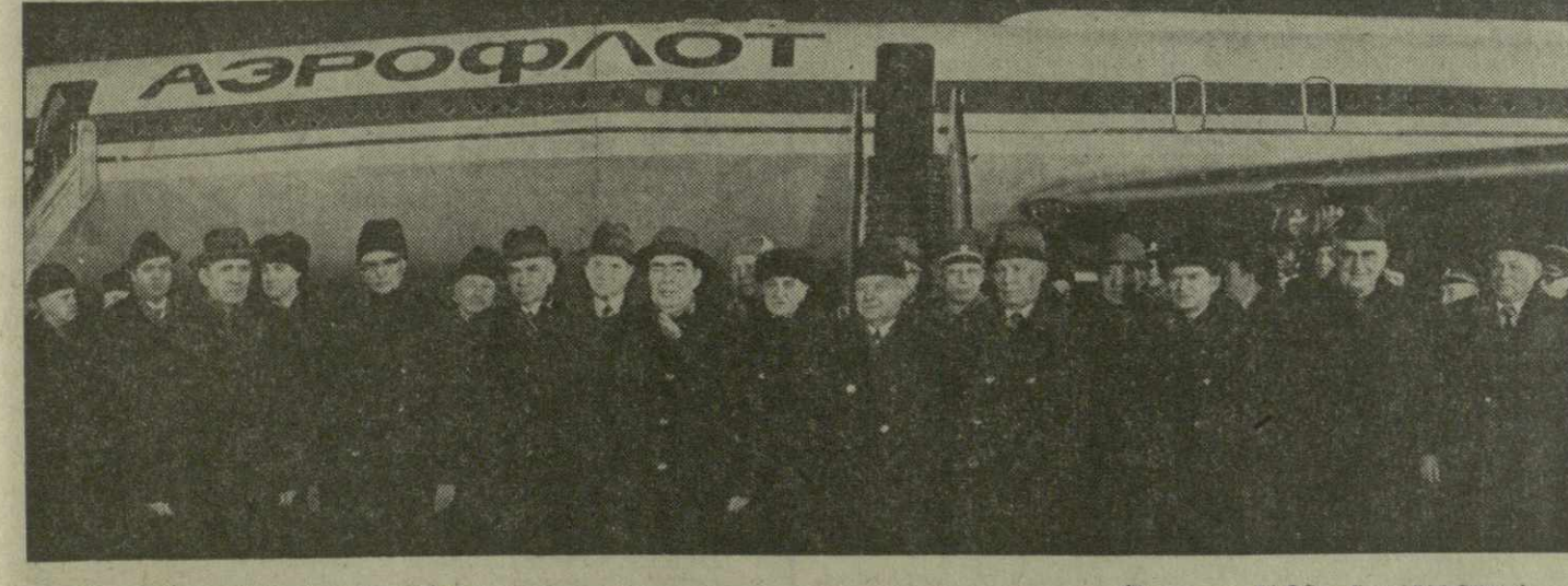
Во время встречи на аэродроме.