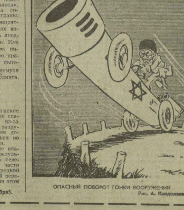
ОПАСНЫЙ ПОВОРОТ ГОНКИ ВООРУЖЕНИЙ. Рис. А. Кандолаки.