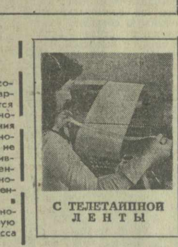
С ТЕЛЕТАИПНОЙ ЛЕНТЫ