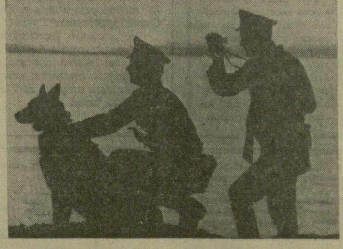
С помощью республиканских организаций строится ряд современных комплексов пограничных застав.

Как самых дорогих гостей встречают на пограничных заставах и кораблях делегации науки и культуры — ученые, композиторы, художники, артисты. Перед воинами постоянно выступают лекторы республиканского общества «Знание». Исключительно важное значение имеют принятые Тбилиским и другими городскими комитетами партии постановления о закреплении на начлах шефства пограничных застав за крупными промышленными предприятиями, такими, как научно-производственное объединение «Элва», тбилисская обувная фабрика «Исани» и другие.