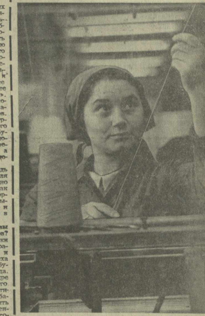
Беседу записал О. ЧИХЛАДЗЕ