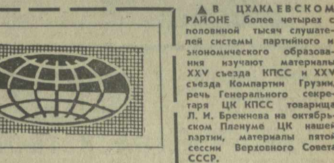
В ЦХАКЕВСКОМ РАЙОНЕ более четырех с половиной тысяч слушателей системы партийного и экономического образования изучают материалы XXV съезда КПСС и XXV съезда Компартии Грузии, речей Генерального секретаря ЦК КПСС товарища Л. И. Брежнева на октябрьском пленуме ЦК нашей партии, материалы пятой сессии Верховного Совета СССР.

КАРАКАС. Диктаторский режим Стресснера в Парагвае создал вблизи столицы страны — города Асунсьона новый концлагерь. В нем находятся и подвергаются пыткам и издевательствам более 430 политзаключенных, большинство из которых — крестьянские руководители.