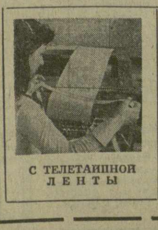
С ТЕЛЕТАЙПНОЙ ЛЕНТЫ

СОВЕТ МИНИСТРОВ ГРУЗИНСКОЙ ССР НАЗНАЧИЛ заместителя председателя Комитета государственной безопасности при Совете Министров Грузинской ССР.