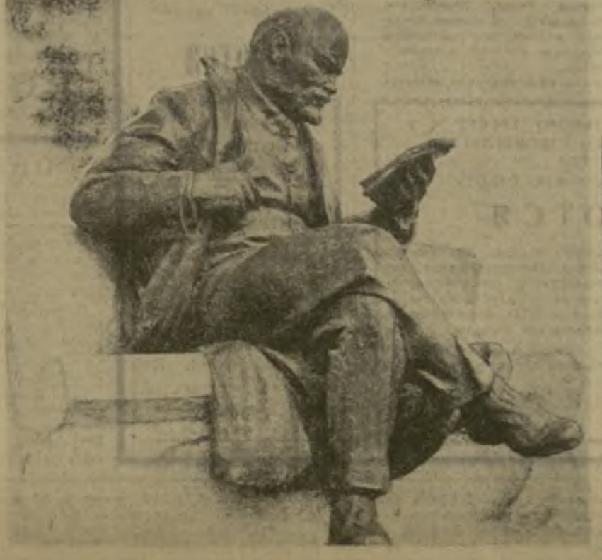
Мастера изобразительного искусства Грузии создали немало произведений, запечатлевших бессмертный образ вождя мирового пролетариата Владимира Ильича Ленина.

Все слушали, латали дышанье. Этот среднего роста человек казался мне теперь исполином.