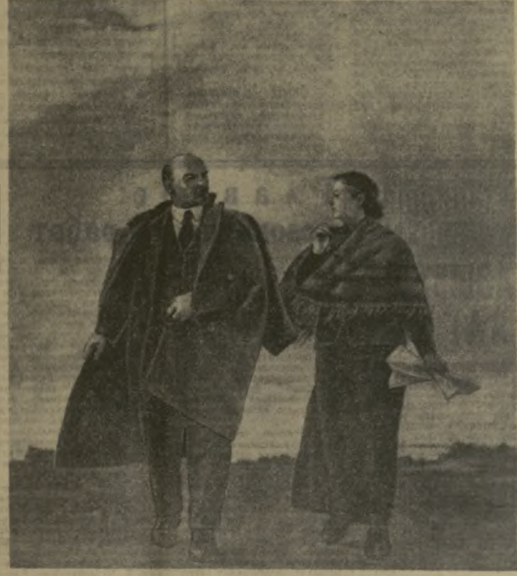
В. И. ЛЕНИН И Н. К. КРУПСКАЯ.

В пороховом развешающем дыме Сгинули беды, блокады и голод, Станьте на ленинской вахте, кто молод В нашей Отчизне!