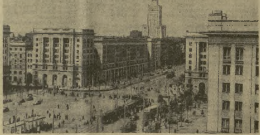
Варшава. Площадь Конституции.

БОНН. «Мы протестуем против закрытия шахт». «Мы требуем, чтобы нас обеспечили работой» — с такими лозунгами вышли на демонстрацию тысячи горняков шахтерского городка Беркхамен-Обераден в Рурской области. Они выразили решительный протест против «рационализации» производства, которая уже привела к закрытию многочисленных каменноугольных предприятий в ФРГ и к увольнению десятков тысяч шахтеров.