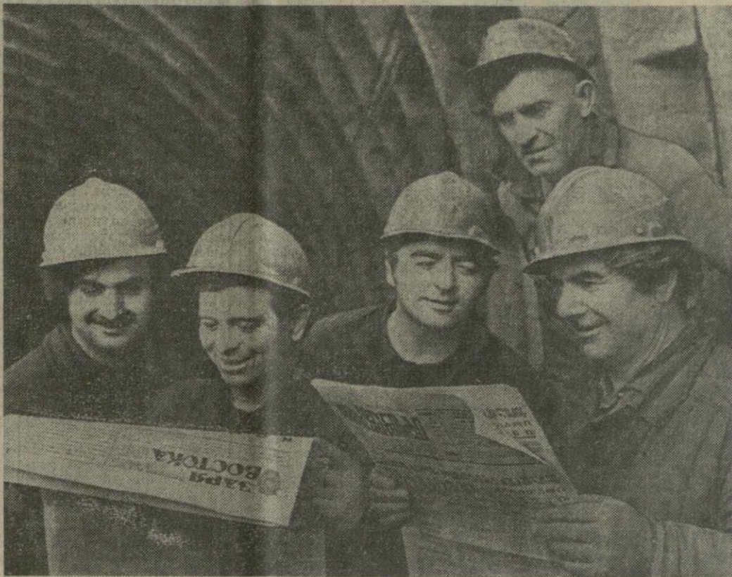
▲ ТРУДЯЩИЕСЯ РЕСПУБЛИКИ с огромным интересом, в обстановке большого политического и трудового подъема, знакомятся с проектом Основного Закона Грузинской Советской Социалистической Республики. На снимке: строители шахты № 29 «Тбилиснелестро» изучают проект новой Конституции Грузинской ССР.

Воспоминания Л. И. Брежнева «Малая земля» на грузинском языке Издательство «Сабхота Сакартавело» выпустило в свет на грузинском языке массовый tiraжом «Воспоминания Генерального секретаря ЦК КПСС, Председателя Президиума Верховного Совета СССР Л. И. Брежнева «Малая земля». Книга отпечатана в типографии Издательства ЦК КП Грузии. (ГрузИНФОРМ).