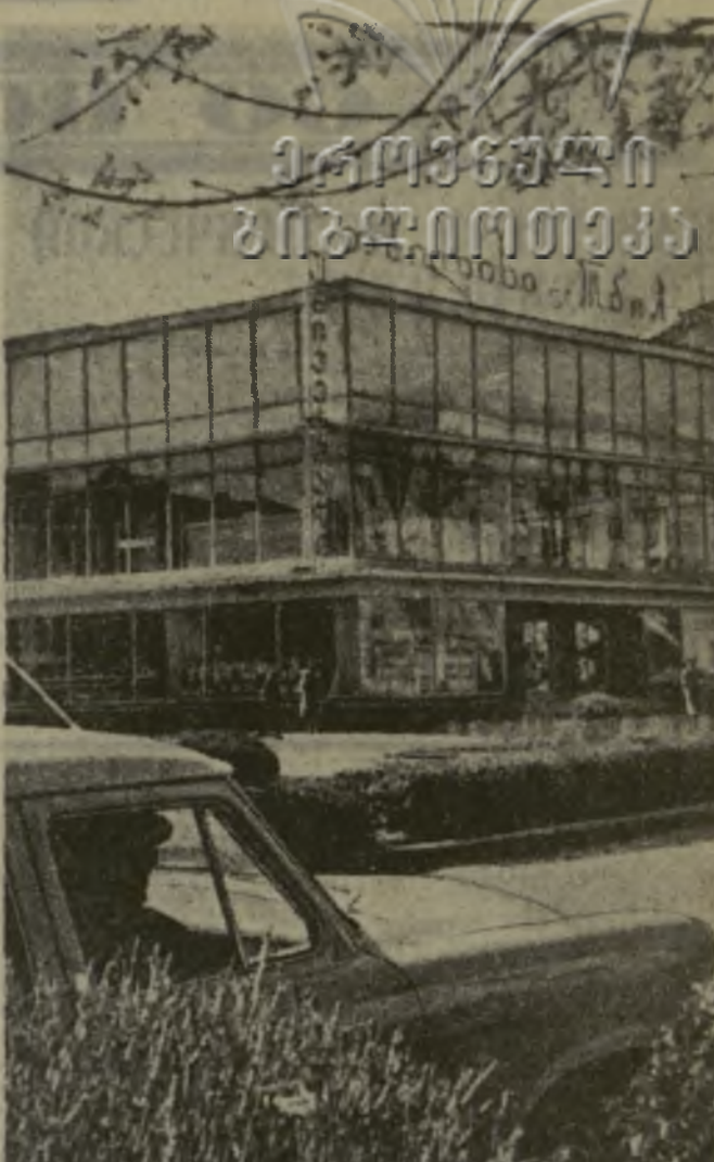
Растет и хорошеет город грузинских металлургов и химиков — Рустави.