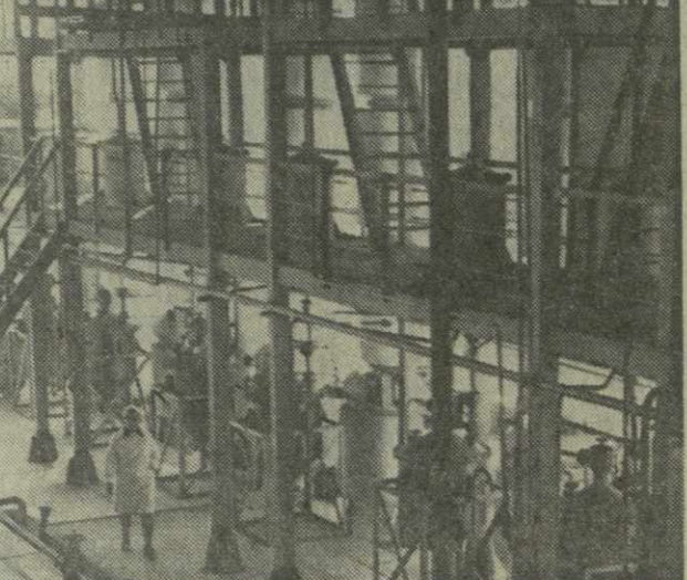
2.500 тонн герани и базиллика — столько будет переработано на Бабушарском эфирномасличном совхозе-заводе, что расположено в Гульришском районе. Только в нынешнем году народное хозяйство страны получит более 4,85 млн килограммов душистого масла этих культур. Широко популярно пользуется также и другое изделие завода — лавровое масло.