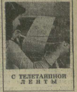
С ТЕЛЕТАИНЫ ЛЕНТЫ

Визитом в ООН советские космонавты завершили свое пребывание в Соединенных Штатах.